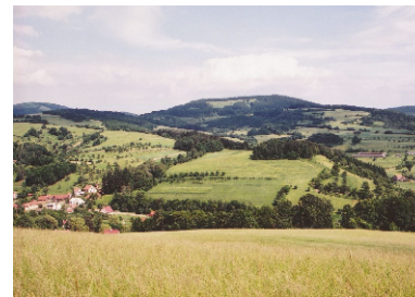
Krajina na Nedašovsku