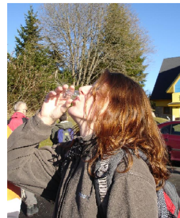
Tož vítajte u nás...

Přijměte pozvání na naučné stezky Bílých Karpat! Provedou vás mnoha zajímavými místy tohoto pohorí, přiblíží vám krásy zdejší přírody i lidové kultury a možná vám přinesou i trochu poučení. V jižní části Bílých Karpat se můžete kochat rozsáhlými komplexy květnatých luk. Tyto louky patří co do počtu rostlinných druhů k nejbohatším v Evropě. Střední část, zvaná Moravské Kopanice, Vás okouzlí pestrou mozaikou rozptýlených stavení, políček, sadů, luk, pastvin a remízků. Možná na Vás dýchne i trochu mystická atmosféra tohoto kraje, vždyť ještě nedávno tu žily vědmy, které bylinkami a zařikáváním dokázaly přivolat lásku, ale i zlé noční můry. Severní část Vám nabízí chodníky vedoucí majestátnými bukovými lesy nebo lázeňskou kolonádu v Luhačovicích. Po procházce Bílými Karpaty zjistíte, jak mimořádně pestrá je zdejší příroda i lidová kultura. Právě proto byla v roce 1979 vyhlášena CHKO Biele Karpaty na jejich slovenské straně a v roce 1980 CHKO Bílé Karpaty na moravské straně. Přírodní a kulturní hodnoty Bílých Karpat byly oceněny i mezinárodně, když v roce 1996 prohlásilo UNESCO Biosférickou rezervaci a když v roce 2000 získaly Diplom chráněných území od Rady Evropy.