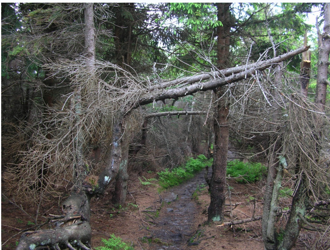
Foto 25: Zdeformované stromy vlivem sněhu na Smrku (J. Štěpánková, červen 2008)