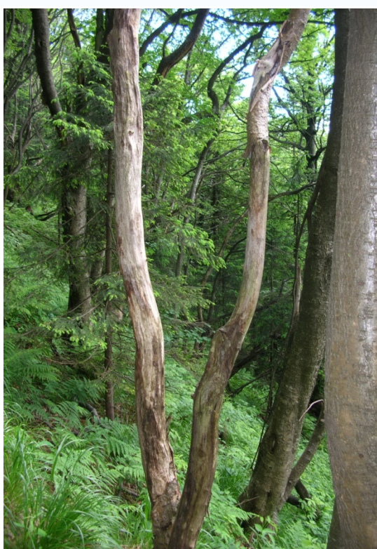
Foto 17: Mrtvý strom vlivem václavky (J. Štěpánková, červen 2008)