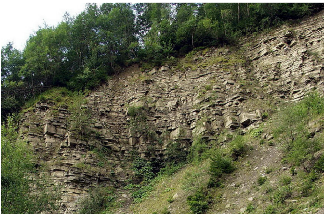
Foto 4: Flyš godulského souvrství vystupujícího v opuštěném lomu v Kněhyni [18]