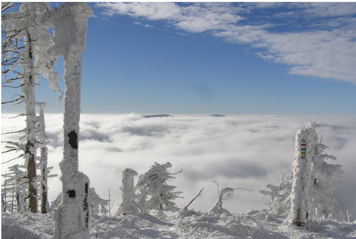
Foto 6: Vrcholy Smrk a Kněhyně nad hranicí inverze (J. Štěpánková, prosinec 2007)