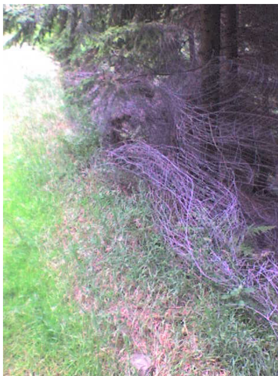
Foto 32: Dělníky zanechané pletivo v lese (J. Štěpánková, červenec 2008)