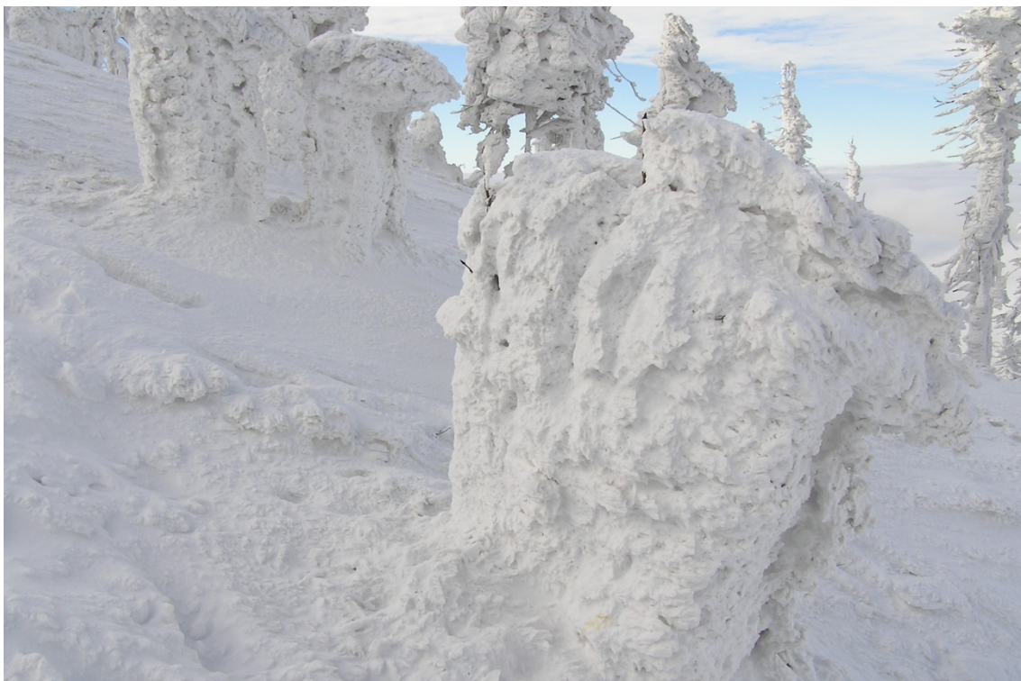
Foto 26: Stromy obalené námrazou na Lysé hoře (J. Štěpánková, prosinec 2007)