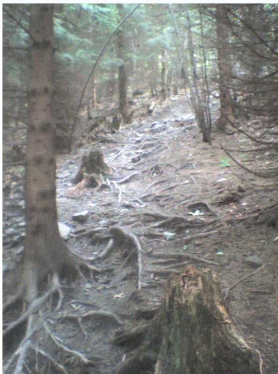
Foto 29: Turisty vzniklý „chodník“ na Lysou horu (J. Štěpánková, listopad 2007)