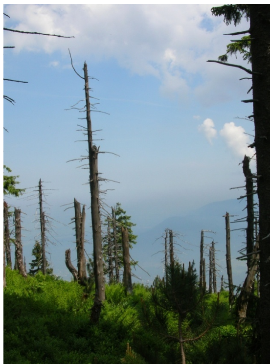
Foto 35: Exhalacemi zničený les na Smrku (J. Štěpánková, červen 2008)