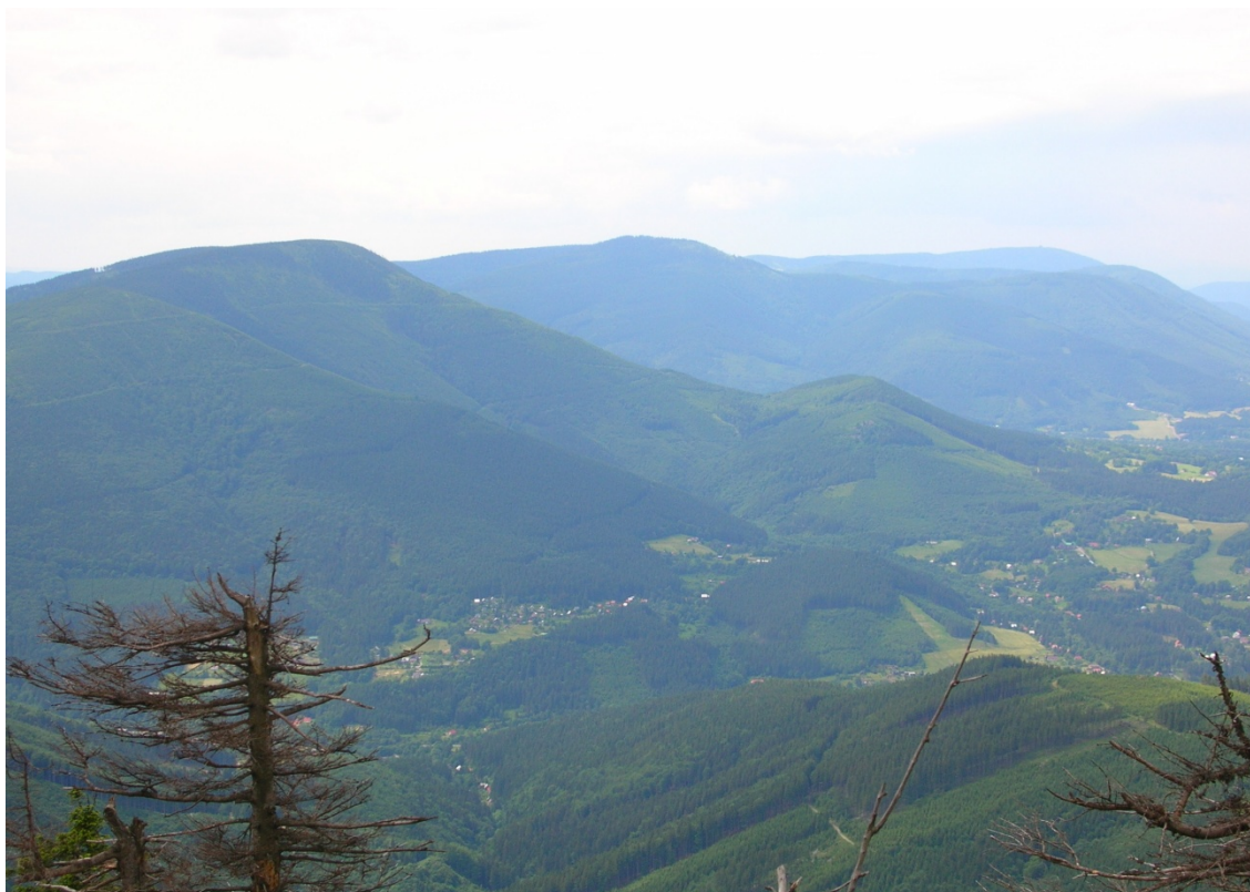
Foto 1: Masiv Smrku, za ním Kněhyně, Stolová a Radhošť (J. Štěpánková, červen 2008)