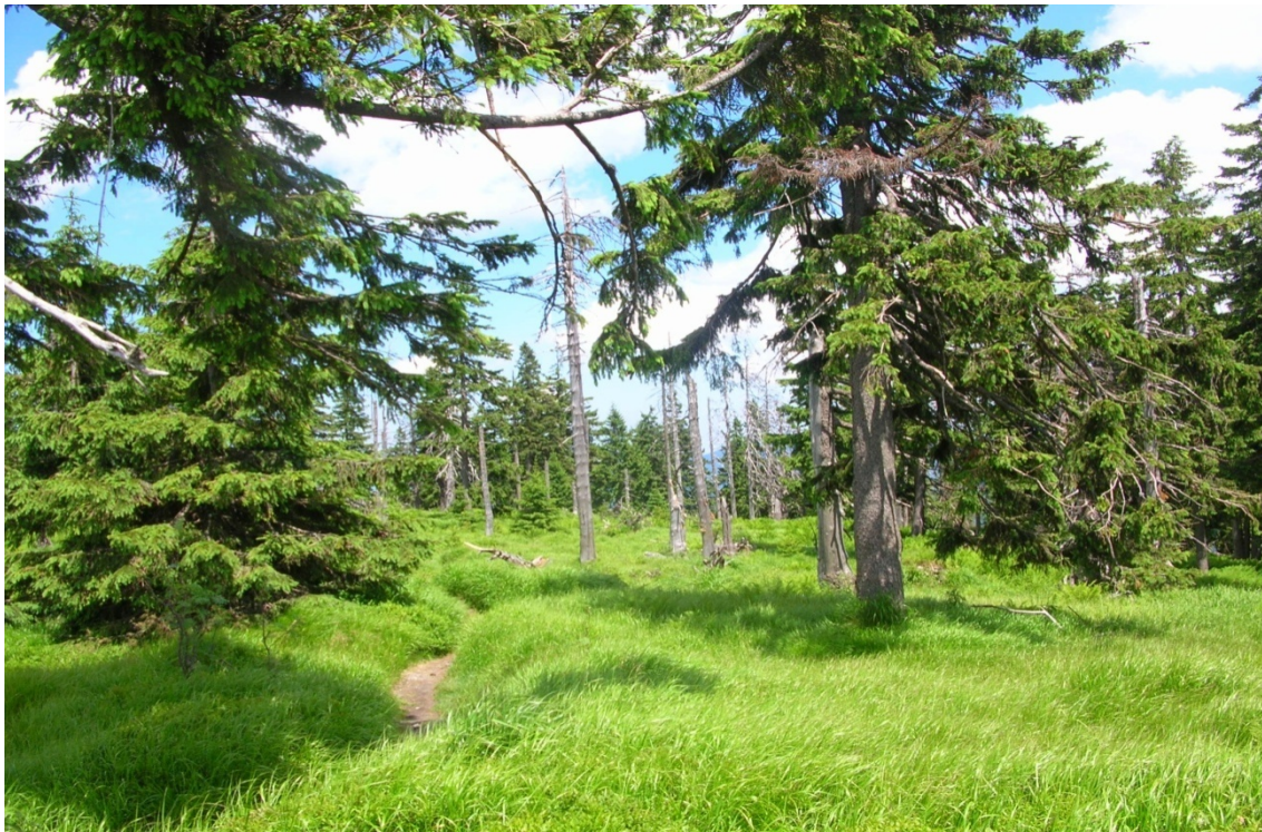
Foto 12: 1. Zóna CHKO BESKYDY na Kněhyni (J. Štěpánková, červen 2008)