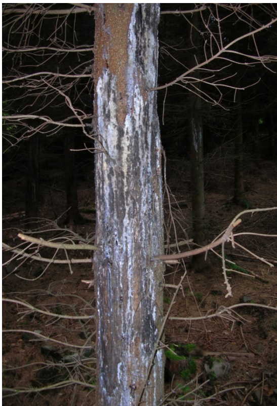
Foto 14, 15: Stromy poškozené jelení zvěří v revíru Čeladná, druhotně napadené pevníkem krvavějícím (J. Štěpánková, červen 2008)