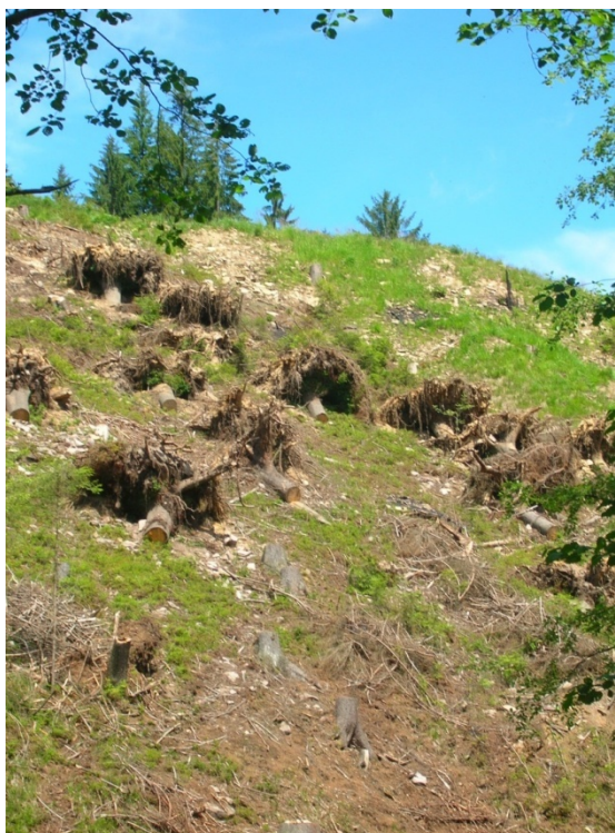
Foto 31: Svah po těžbě dřeva na Bílé (J. Štěpánková, červen 2008)