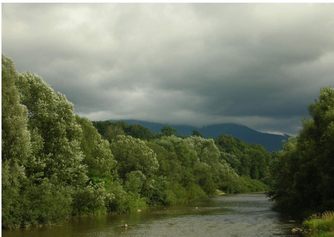
Foto 2: Řeka Ostravice, v pozadí masiv Lysá hora (J. Štěpánková, květen 2007)