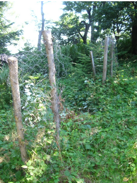
Foto 72, 73: Podsadby buku, chráněného před okusem zvěří nátěrem a pletivem (J. Štěpánková, červen 2008)