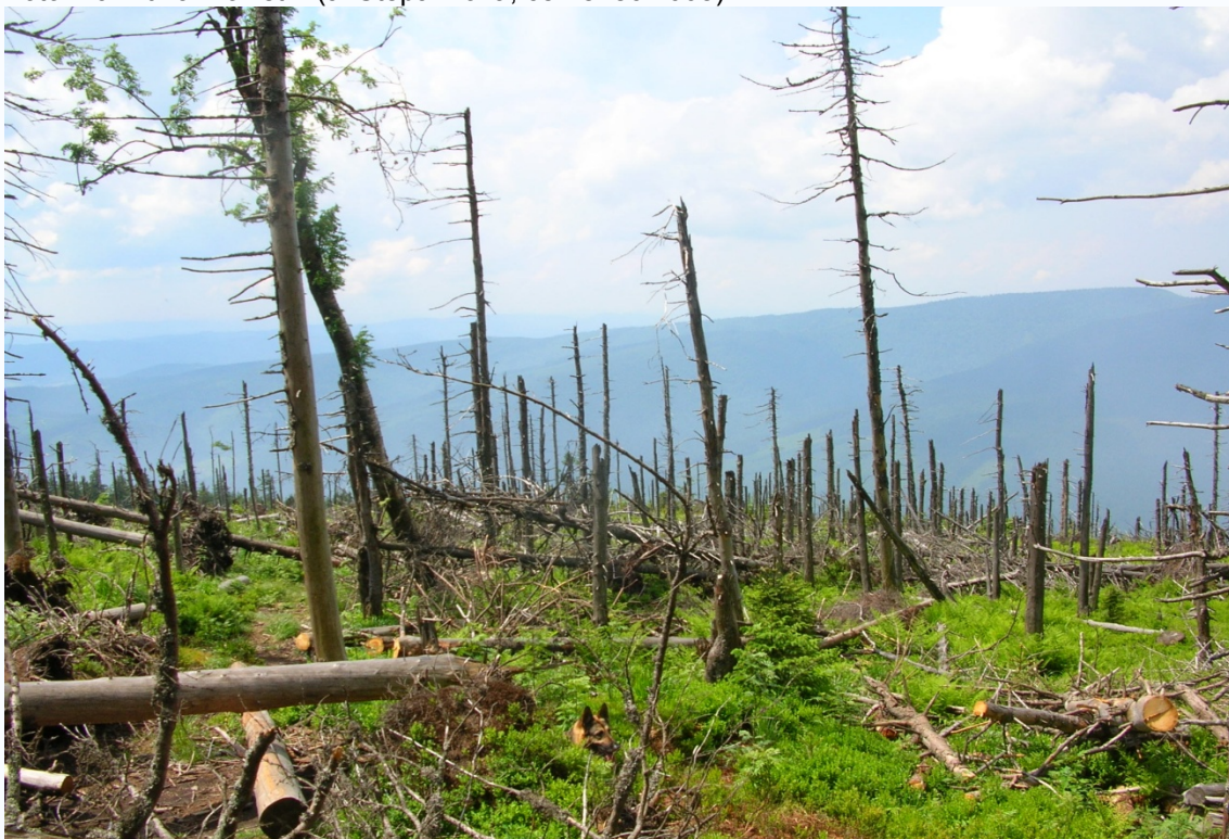
Foto 20, 21, 22: Polom na Smrku, exhalacemi oslabené dřevo, málo odolné větrům (J. Štěpánková, červen 2008)