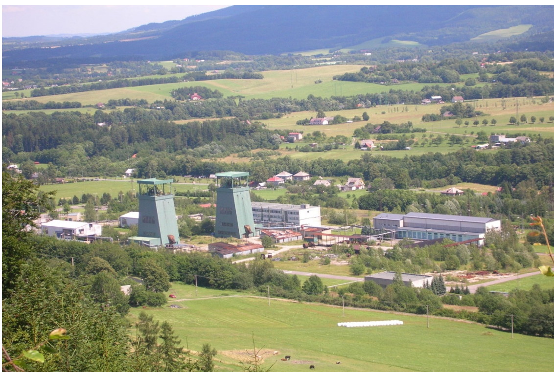
Foto 36: Budoucí hrozba, zakonzervovaný důl v Trojanovicích (J. Štěpánková, červenec 2008)