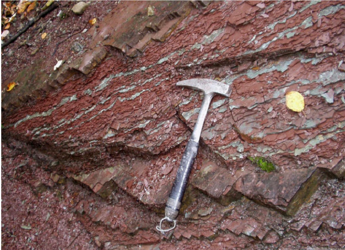
Foto 5: Výchozy pestrých jílovců mazáckých vrstev cenomanského stáří v lomu Mazák v obci Ostravice [18]