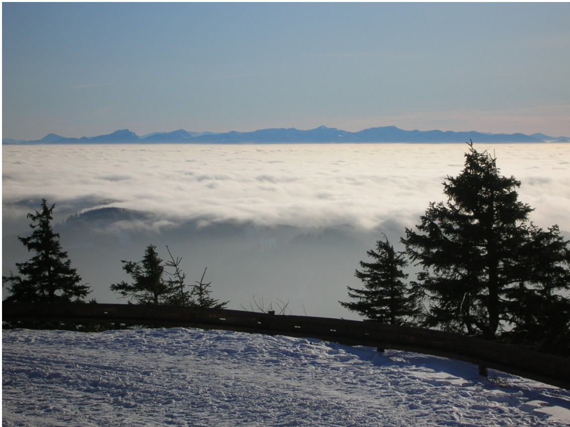
Foto 7: Typická inverzní situace, pod mraky Baraní, v pozadí Západní a Vysoké Tatry (J. Štěpánková, prosinec 2007)