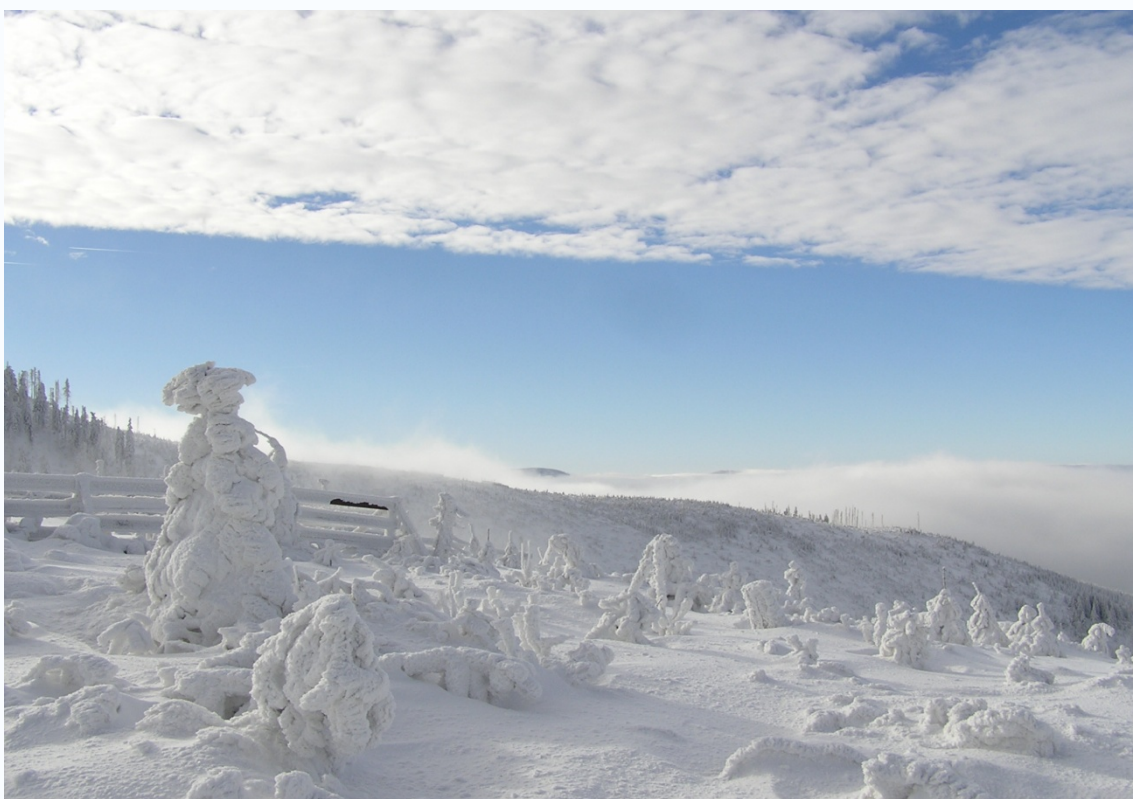
Foto 27: Stromy obalené námrazou na Lysé hoře (J. Štěpánková, prosinec 2007)