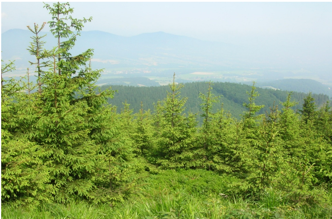
Foto 8: Nové smrkové monokultury na Smrku (J. Štěpánková, červen 2008)