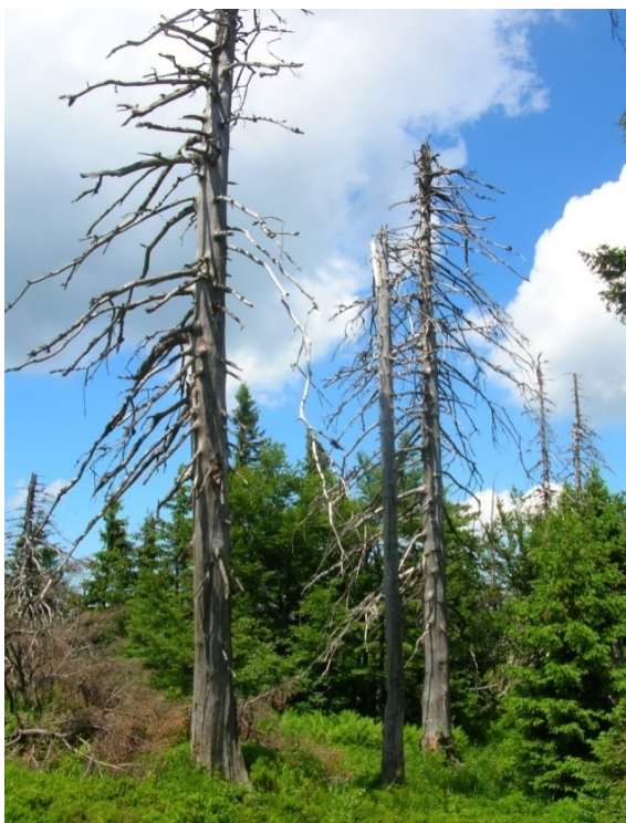
Foto 34: Exhalacemi zničený les na Kněhyni (J. Štěpánková, červen 2008)