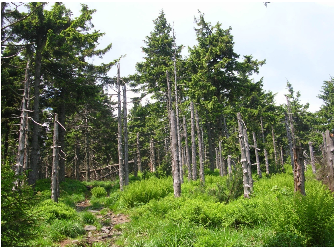
Foto 13: 1. Zóna CHKO BESKYDY na Smrku (J. Štěpánková, červen 2008)