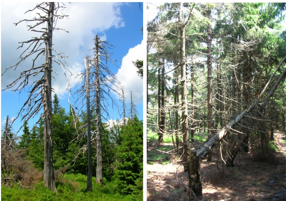
Foto 23, 24: Bajonetové a zlomené stromy vlivem sněhu v 1. Zóně CHKO Beskydy na Kněhyni a Smrku (J. Štěpánková, červen 2008)