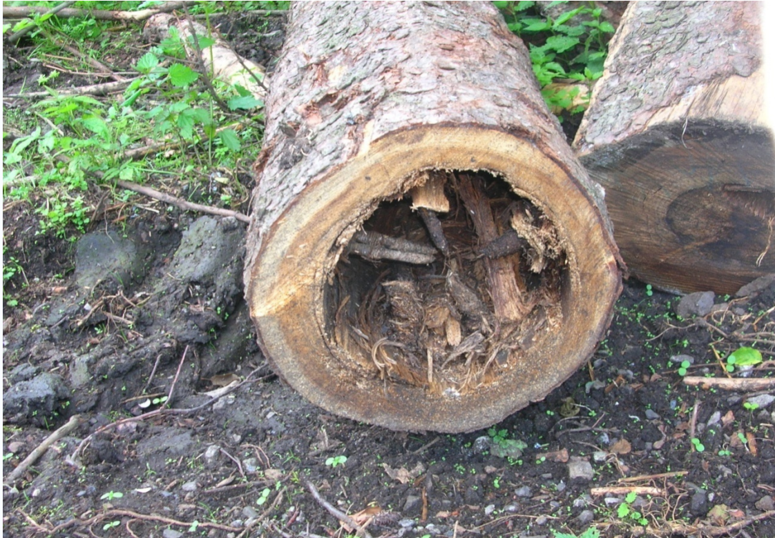
Foto 18: Strom nahodilé těžby napadený kořenovníkem vrstevnatým (J. Štěpánková, červen 2008)