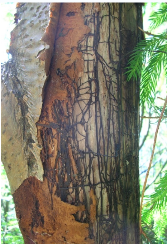
Foto 16: Strom napadený václavkou na Kněhyni (J. Štěpánková, červen 2008)