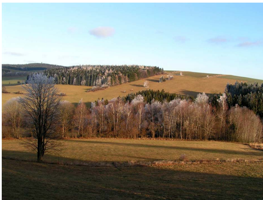
Obr. 24. Severní svah kopce Teplá, 782 m n. m. - topoklima ovlivněné konvexním tvarem reliéfu (Havlíčková, prosinec 2006)