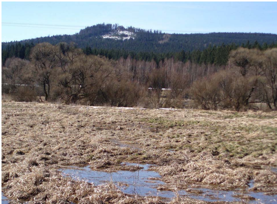
Obr. 22. Málo osluněný severní svah pod Malinskou skálou - topoklima ovlivněné orientací (Havlíčková, duben 2008)