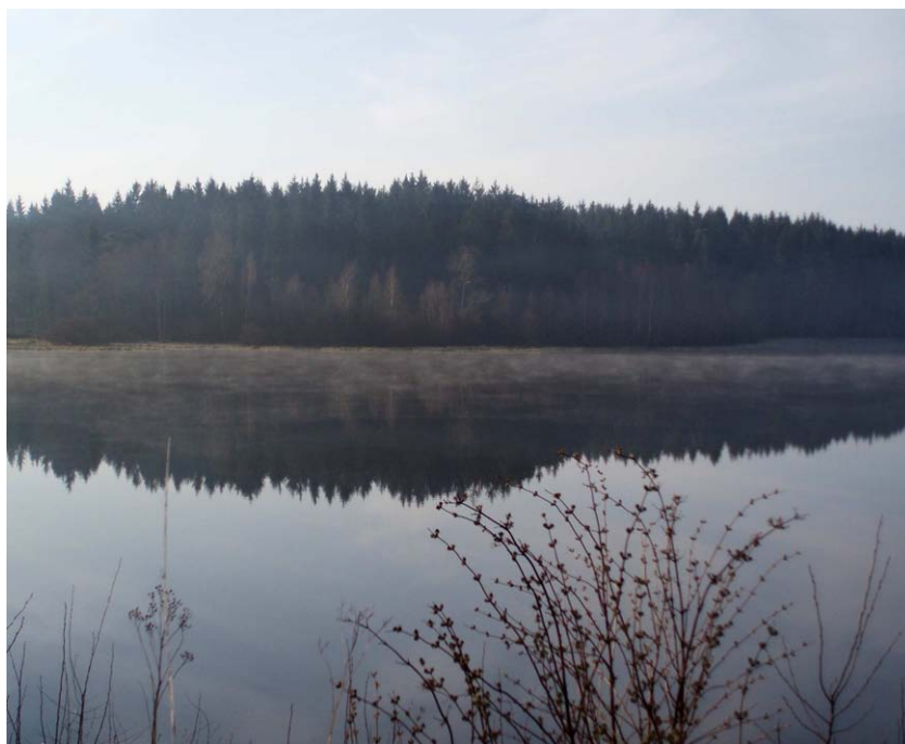
Obr. 11. Mlha z vypařování nad vodní hladinou Nového rybníka (Havlíčková, duben 2008)