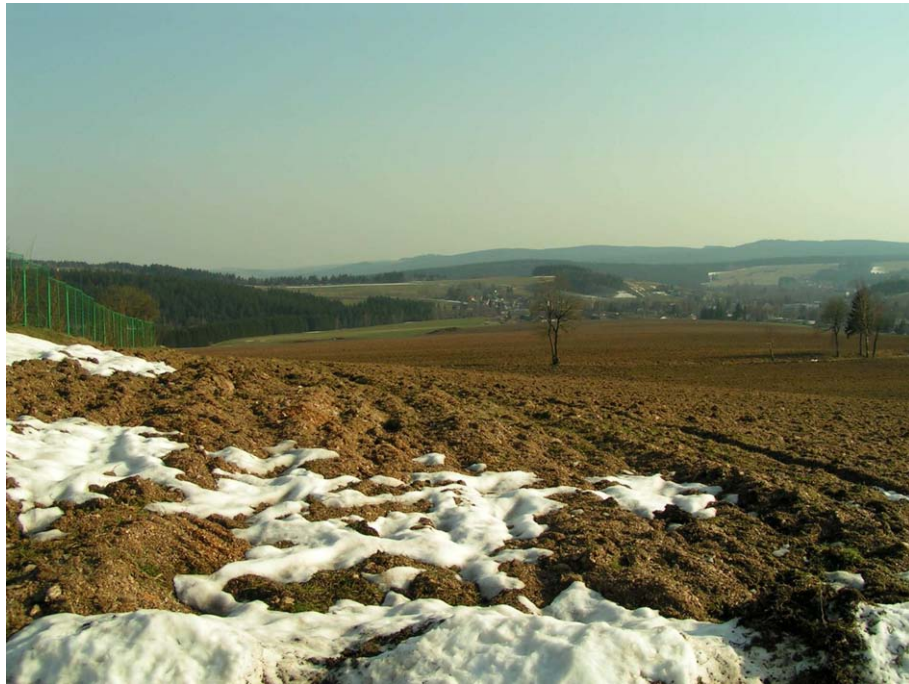
Obr. 15. Pole na jižním svahu kopce Otava - topoklima ovlivněné holou plochou (Havlíčková, duben 2007)