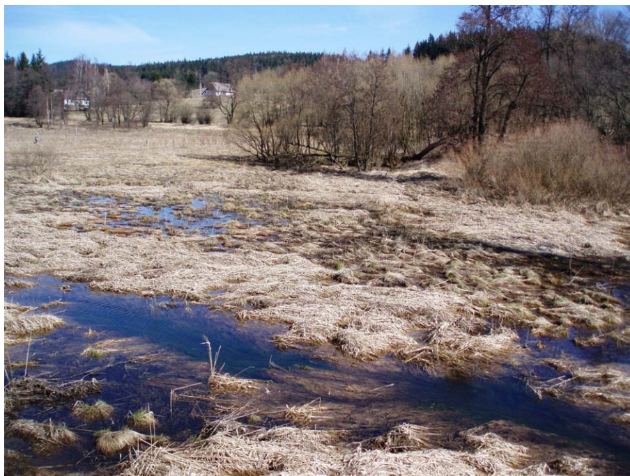
Obr. 23. Milovy - topoklima ovlivněné zamokřenou plochou (Havlíčková, duben 2008)