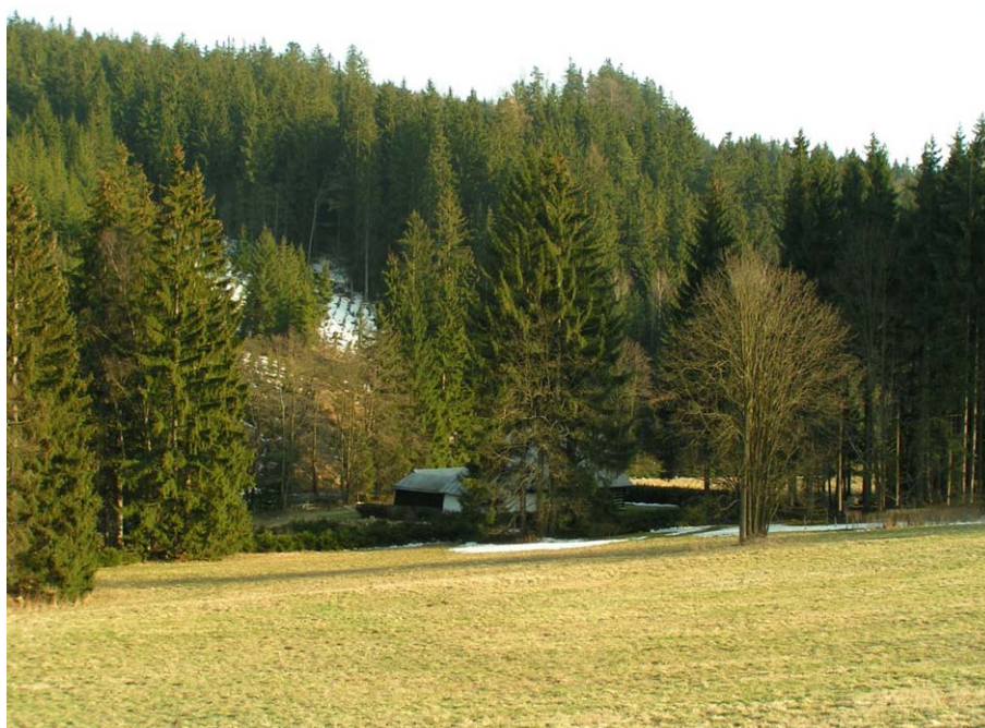
Obr. 14. Severní svahy Vysokého kopce (806 m n. m.) při pravém břehu řeky Svatky - topoklima ovlivněné orientací a hustým lesním porostem (Havlíčková, duben 2007)