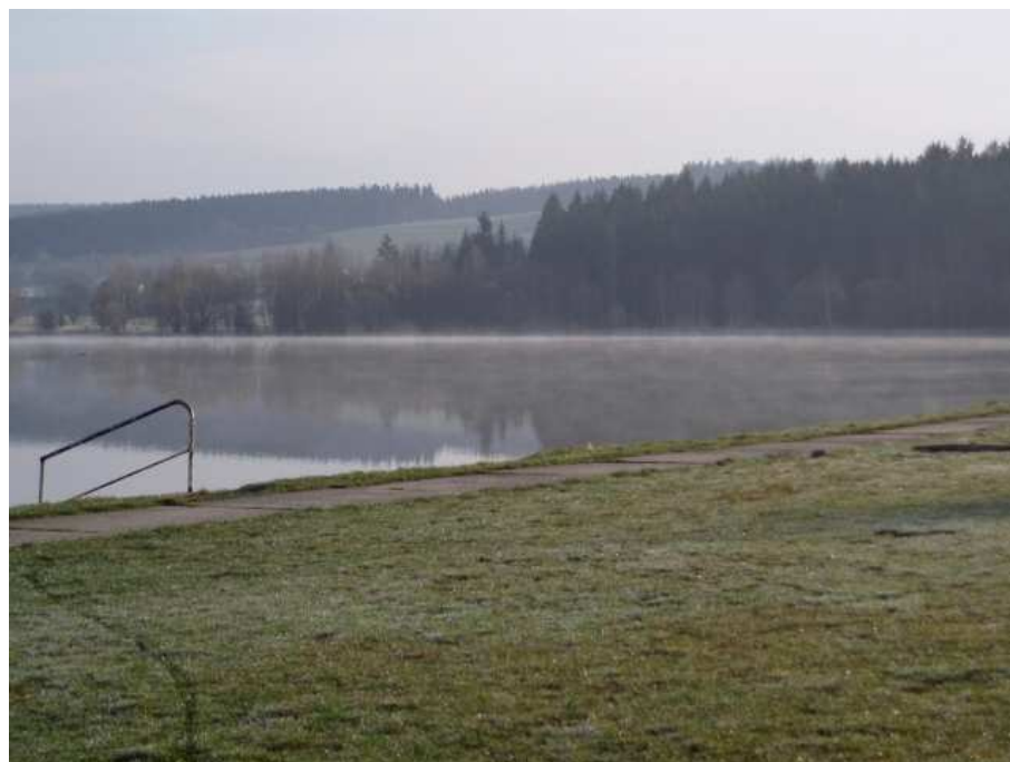
Obr. 10. Mlha z vypařování nad vodní hladinou rybníka Dářko (Havlíčková, duben 2008)