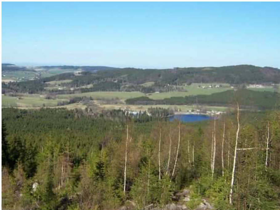
Obr. 8. Milovská kotlina - topoklima konkávního tvarem reliéfu (Havlíčková, duben 2007)