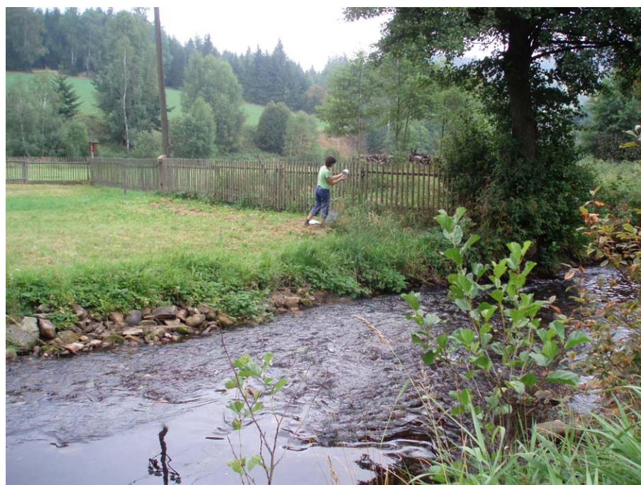
Obr. 4. Stanice Krásné, 550 m n. m. - topoklima ovlivněné konkávním tvarem reliéfu (Havlíčková, srpen 2007)