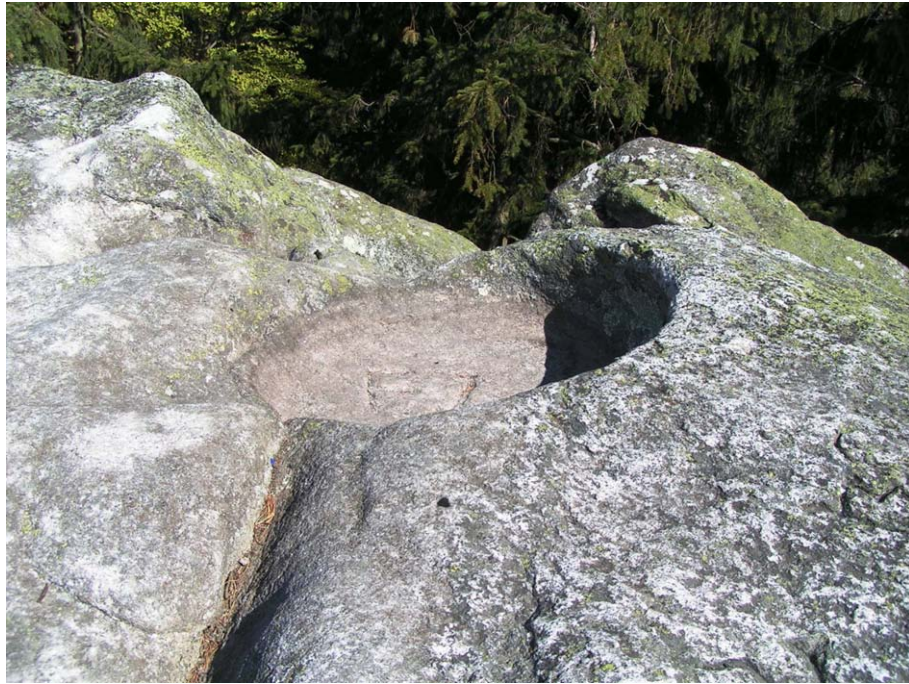
Obr. 7. Milovské Perničky - skalní mísa