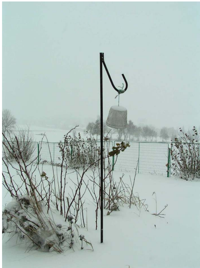
Obr. 20. Stanice Svatouch - topoklima ovlivněné sněhovou pokrývkou (Havlíčková, listopad 2007)