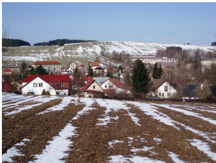
Obr. 18. Inverzní údolí u obce Svratouch, pohled od východní strany (Havlíčková, březen 2008)