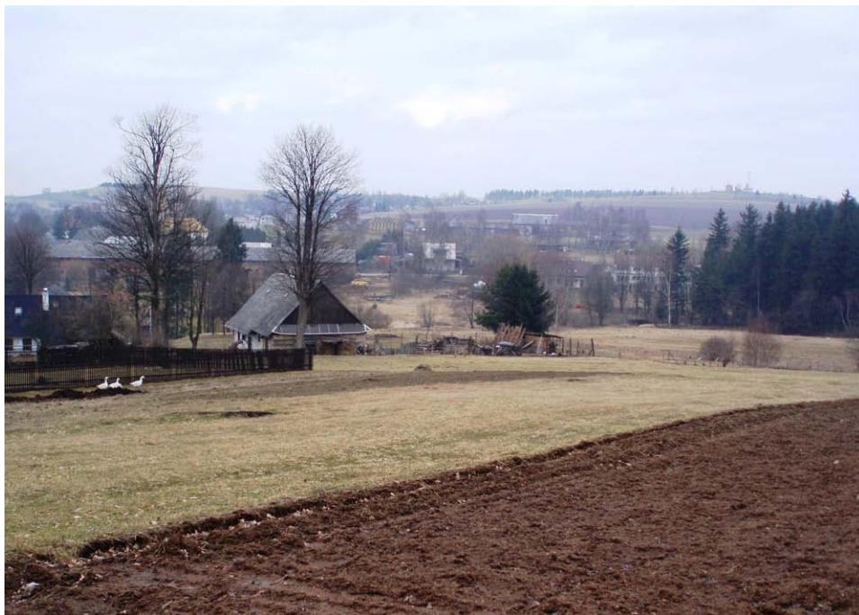
Obr. 16. Pole nad obcí Svratouch - topoklima ovlivněné holou plochou (Havlíčková, březen 2008)