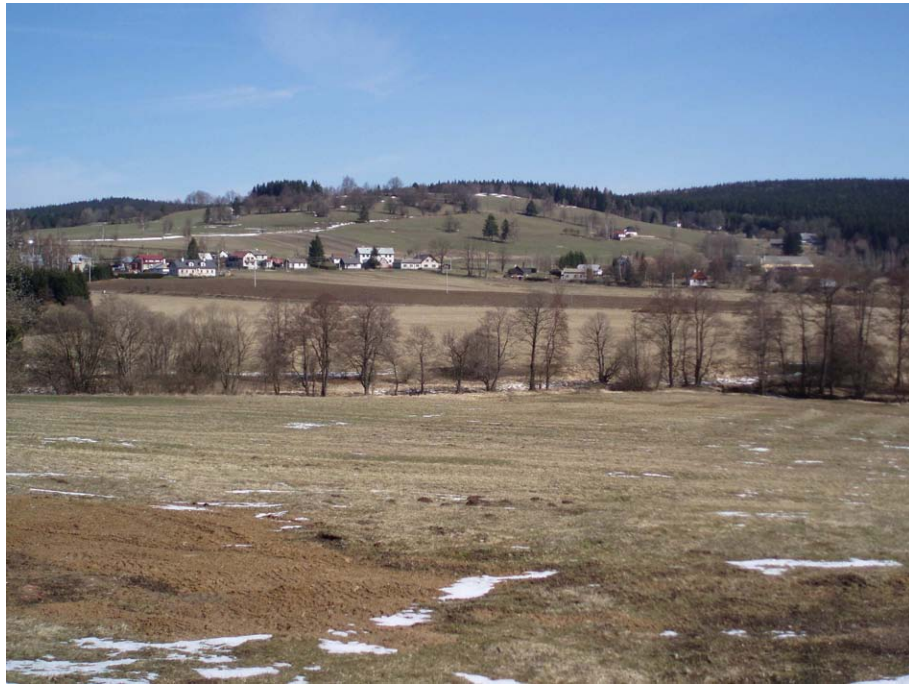
Obr. 21. Dobře osluněný jihozápadní svah u obce Březiny - topoklima ovlivněné orientací (Havlíčková, březen 2008)