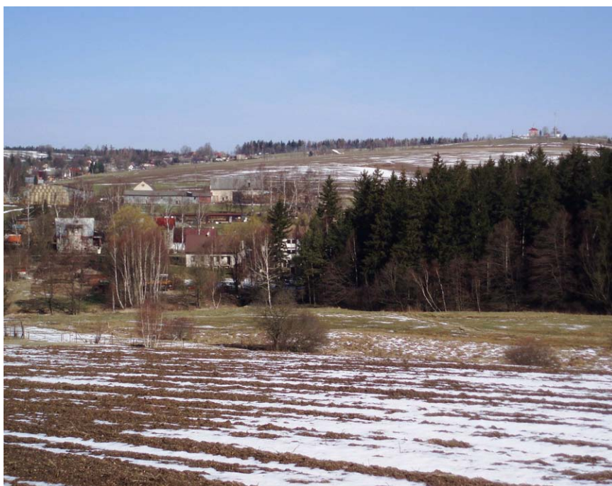
Obr. 17. Kopec Otava - topoklima ovlivněné konvexním tvarem reliéfu (Havlíčková, březen 2008)