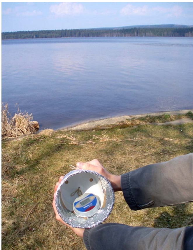
Obr. 2. Stanice Dářko, 615 m n. m. - topoklima ovlivněné rozsáhlou vodní plochou (Havlíčková, duben 2007)