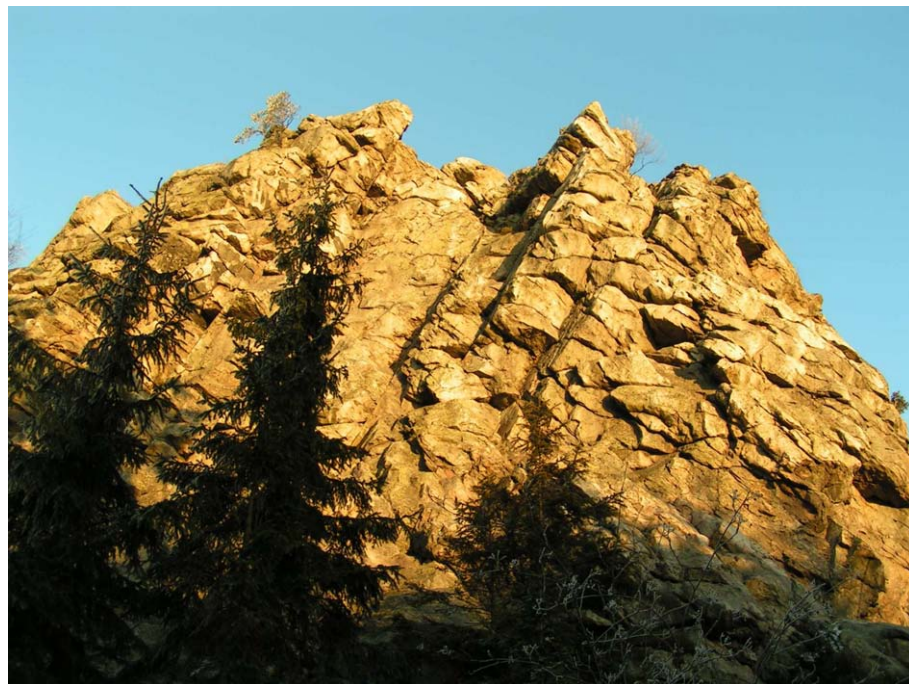
Obr. 6. Drátenická skála (Havlíčková, prosinec 2006)