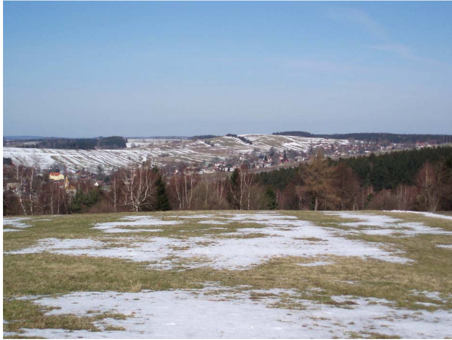
Obr. 19. Inverzní údolí u obce Svatka, pohled ze severovýchodu (Havlíčková, březen 2008)