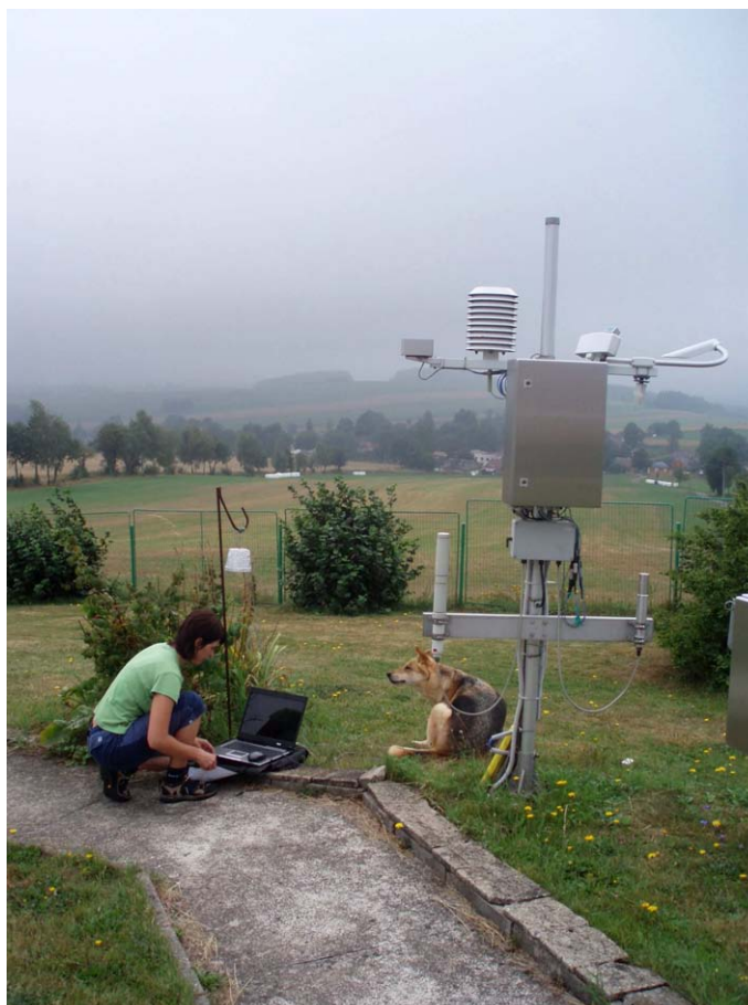
Obr. 3. Stanice Svatouch, 734 m n. m. - topoklima ovlivněné konvexním tvarem reliéfu (Havlíčková, srpen 2007)