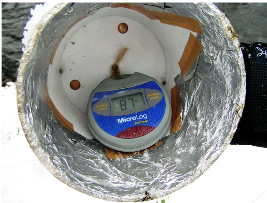
Obr. 1. Digitální sběrnice MicroLog