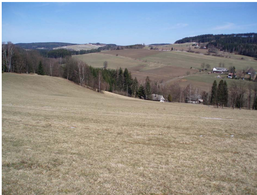
Obr. 13. Topoklima ovlivněné konkávním tvarem reliéfu - pohled do údolí řeky Svatky z východního svahu bezejmenného kopce u obce Krásné (Havlíčková, duben 2008)