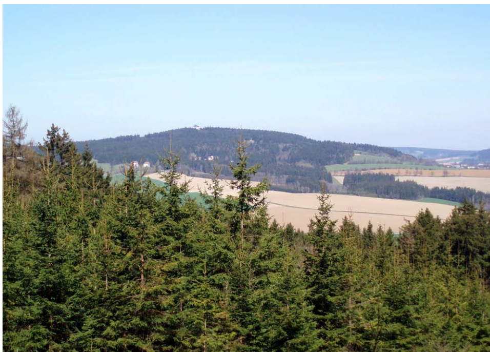
Obr. 9. Buchtův kopec, 813 m n. m. - topoklima konvexního tvaru reliéfu (Havlíčková, duben 2007)