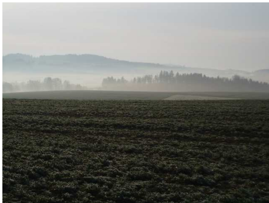
Obr. 12. Nízká radiační mlha nad polem u obce Stržanov (Havlíčková, květen 2008)