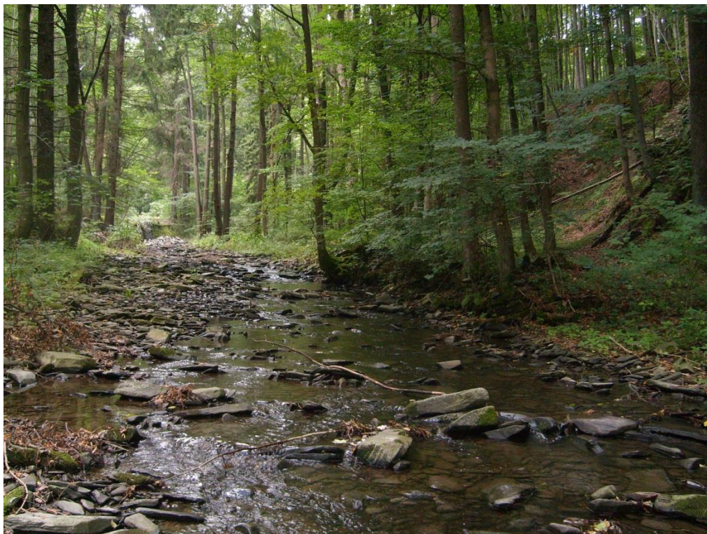
Obr. 1: Koryto Sitky v lokalitě PP Sovinecko