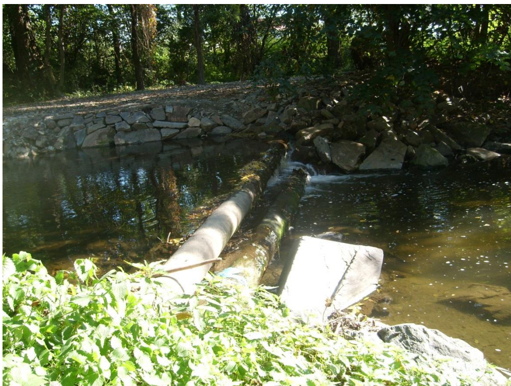
Obr. 29: Regulovaný tok za městem Šternberk (Milan Poláček, 2013)