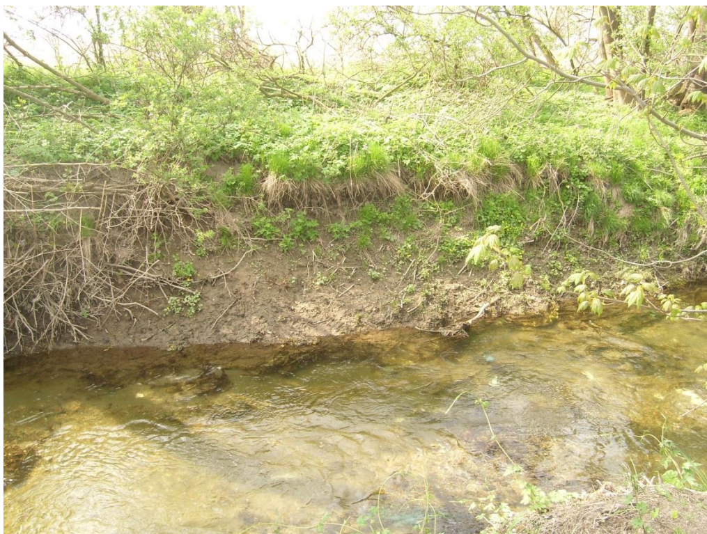
Obr. 17: Břehová nátrž v lokalitě Moravská Huzová