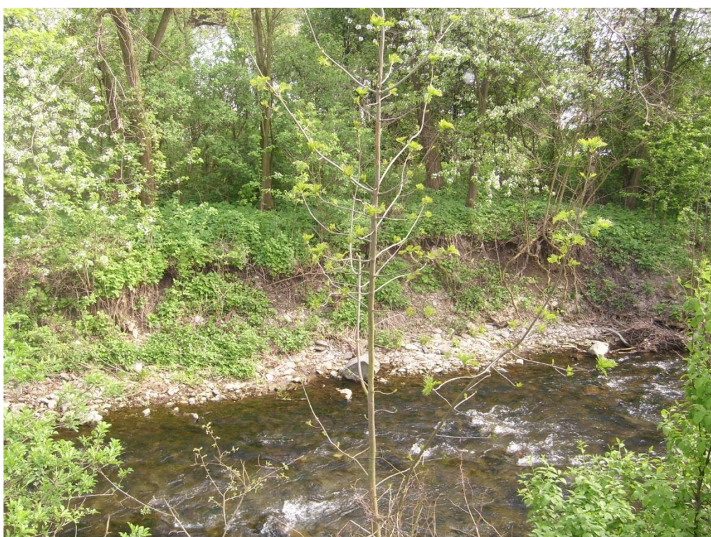
Obr. 18: Břehová nátrž v lokalitě Šternberk (Milan Poláček, 2013)