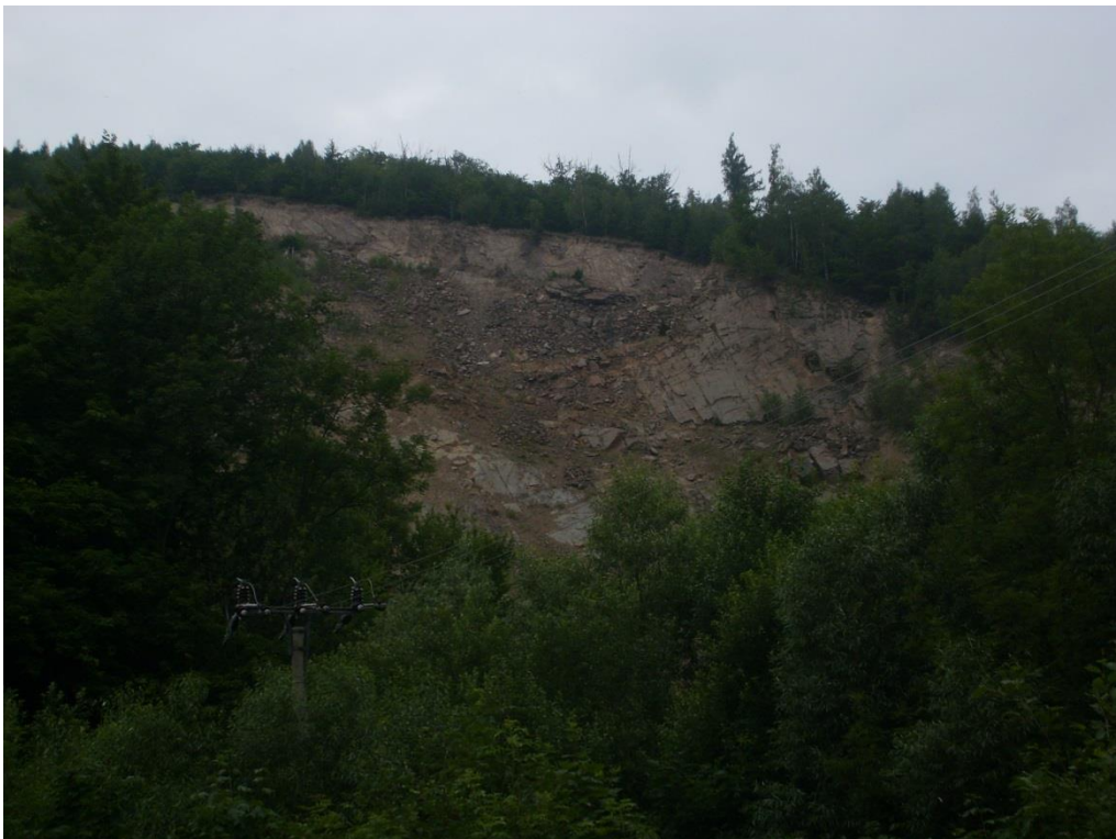
Obr. 26: Kamenolom Horní Žleb (Milan Poláček, 2012)