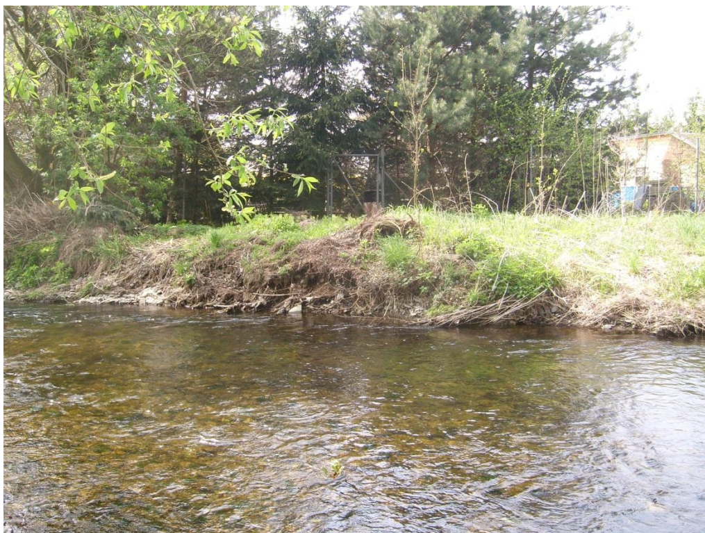
Obr. 11: Břehová nátrž v lokalitě Lužice (Milan Poláček, 2013)