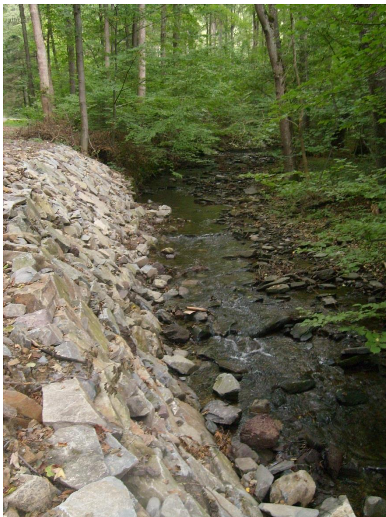
Obr. 31: Zpevněný tok Sítky v lokalitě Horní Žleb (Milan Poláček, 2012)