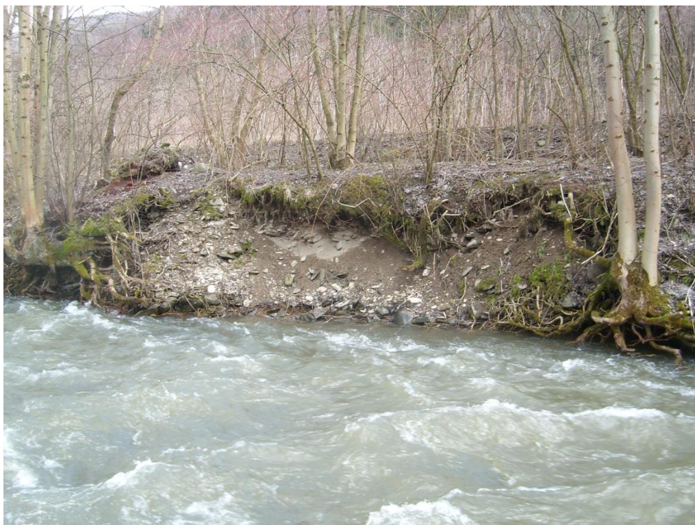
Obr. 9: Břehová nátrž v lokalitě Dolní Žleb