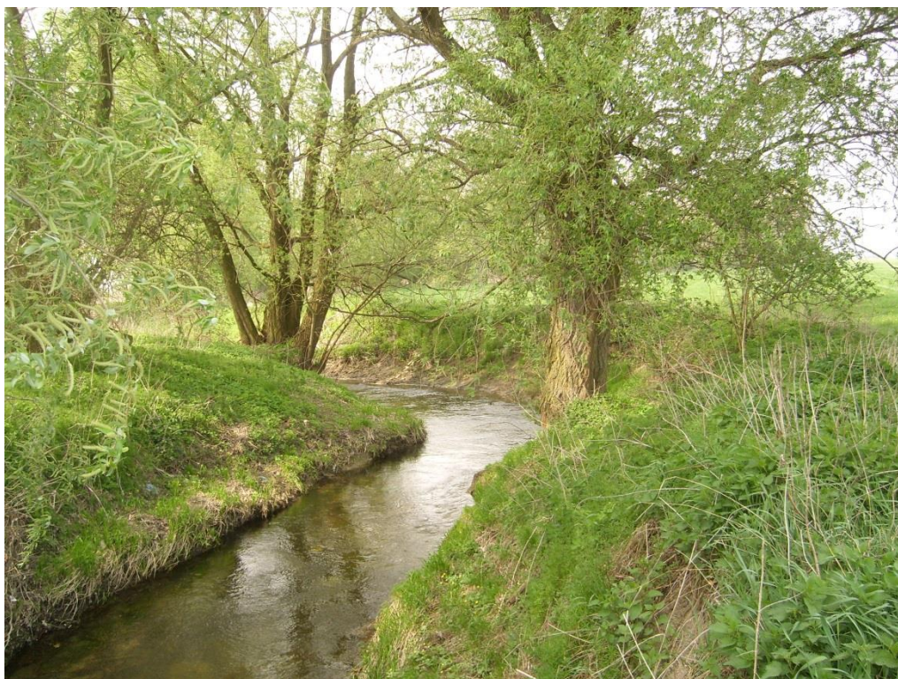
Obr. 5: Zákrut Sitky v lokalitě Moravská Huzová (Milan Poláček, 2013)