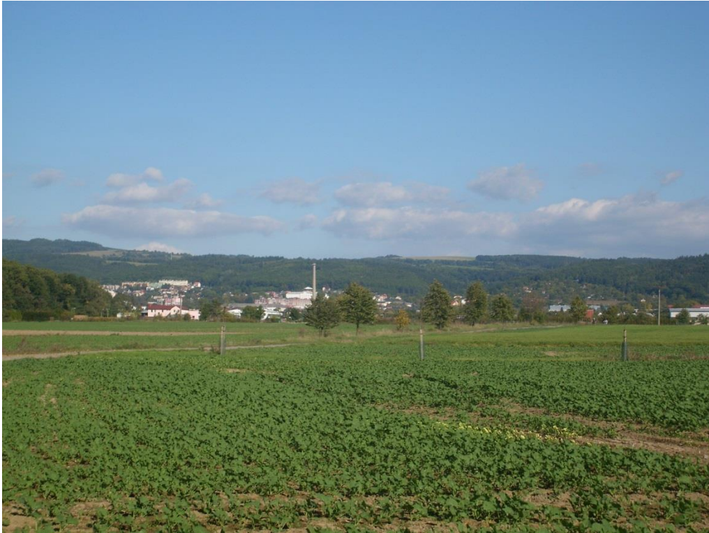
Obr. 25: Pohled na město Šternberk, Jívovská vrchovina