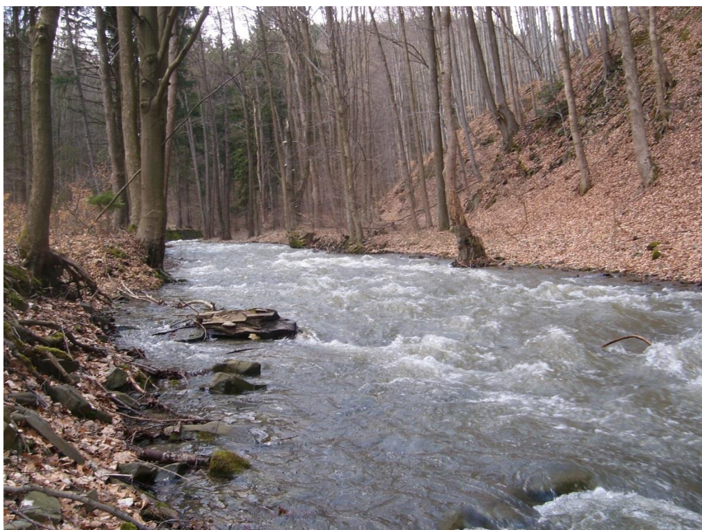
Obr. 2: Koryto Sitky v lokalitě PP Sovinecko (Milan Poláček, 2013)