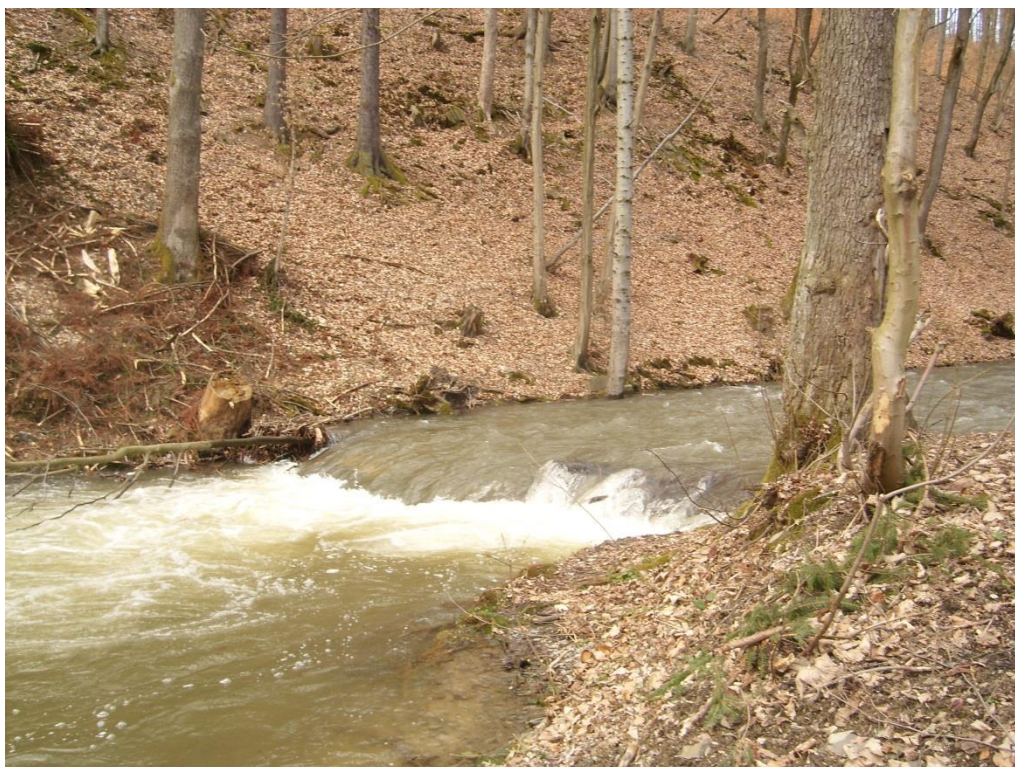
Obr. 3: Koryto Sitky v lokalitě Horní Žleb (Milan Poláček, 2013)