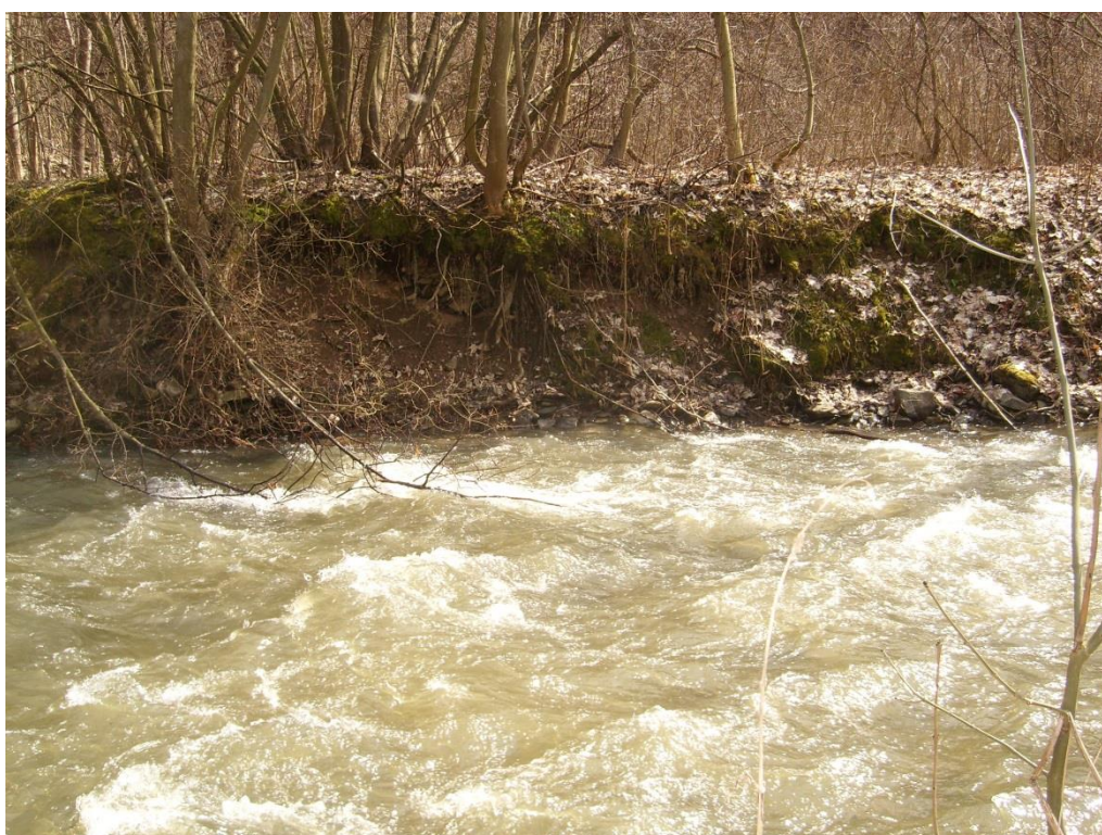
Obr. 10: Obr. 9: Břehová nátrž v lokalitě Dolní Žleb (Milan Poláček, 2013)