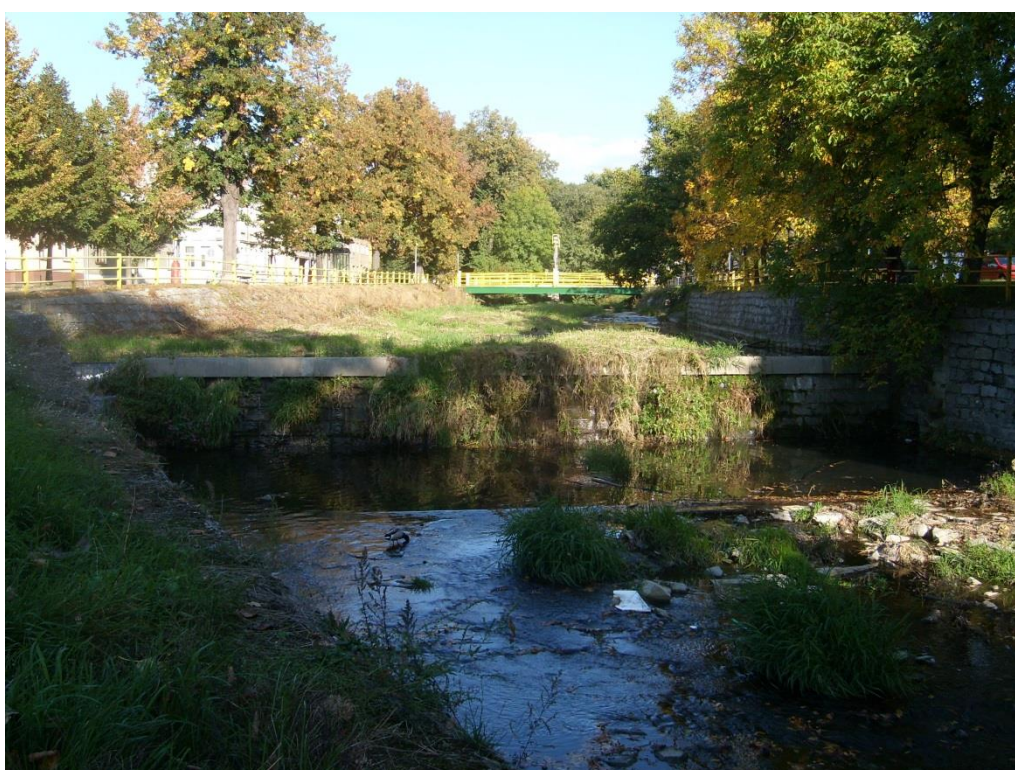
Obr. 28: Splav v lokalitě Šternberk (Milan Poláček, 2012)