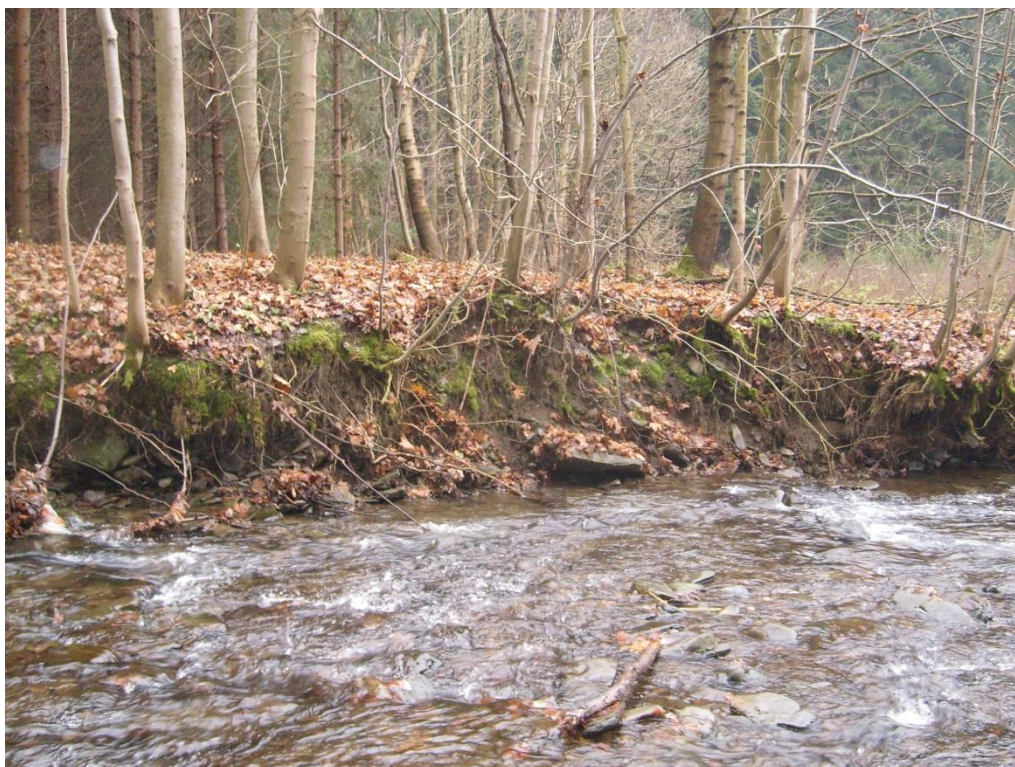
Obr. 7: Břehová nátrž v lokalitě Horní Žleb (Milan Poláček, 2012)