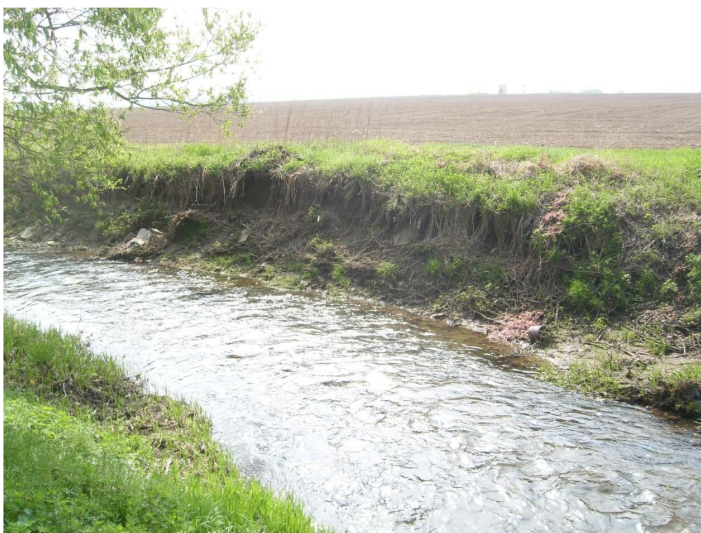
Obr. 14: Břehová nátrž v lokalitě Moravská Huzová (Milan Poláček, 2013)