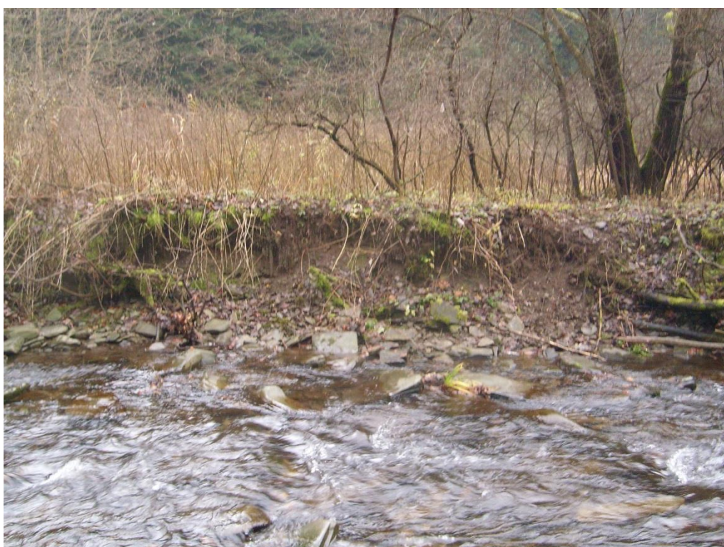
Obr. 8: Břehová nátrž v lokalitě Horní Žleb (Milan Poláček, 2012)