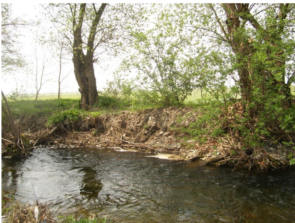
Obr. 12: Břehová nátrž v lokalitě Lužice (Milan Poláček, 2013)