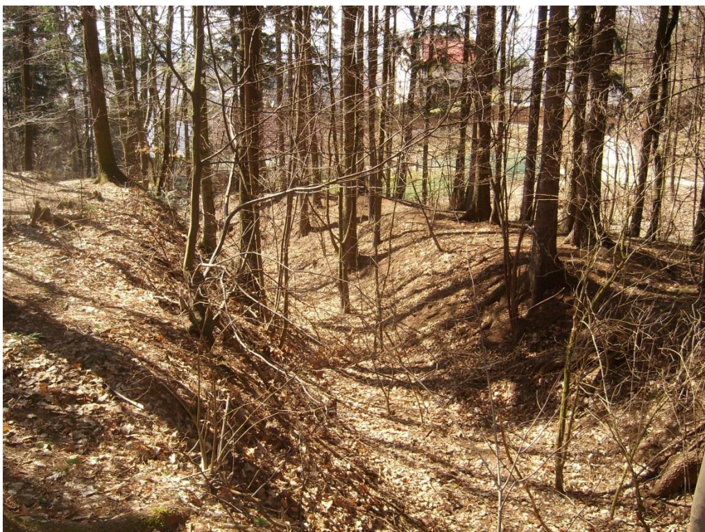
Obr. 22: Strž typu ovrag v lokalitě Babí Hora (Milan Poláček, 2013)