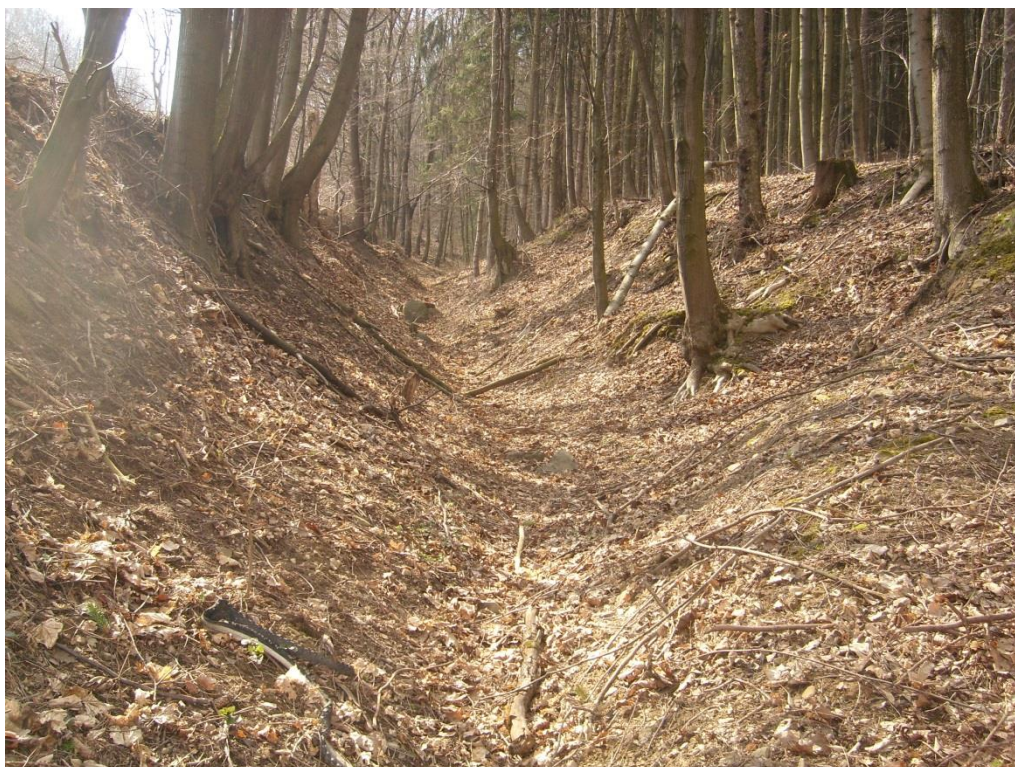
Obr. 19: Strž typu ovrág v lokalitě Šternberk (Milan Poláček, 2013)