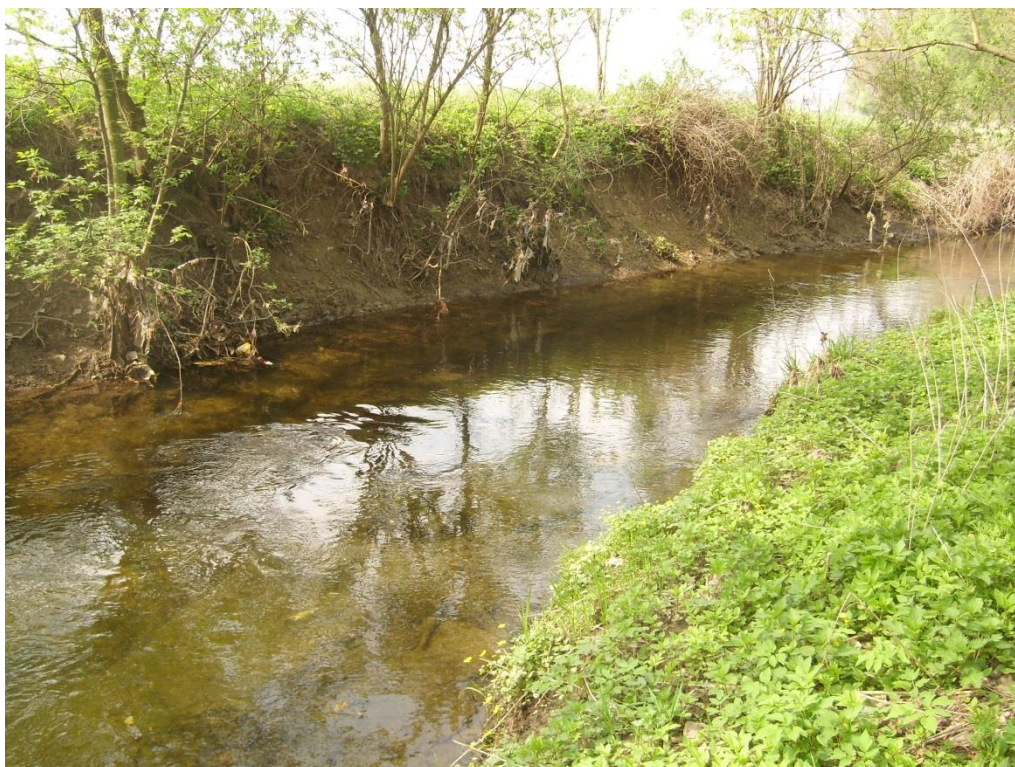
Obr. 15: Břehová nátrž v lokalitě Moravská Huzová