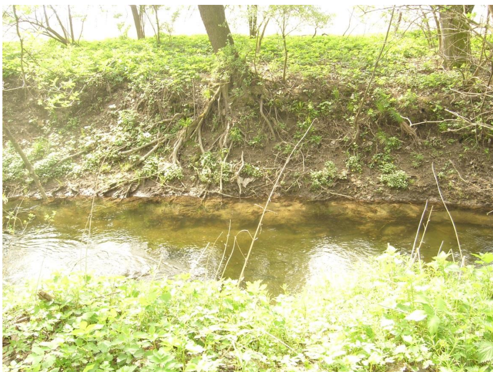
Obr. 16: Břehová nátrž v lokalitě Moravská Huzová