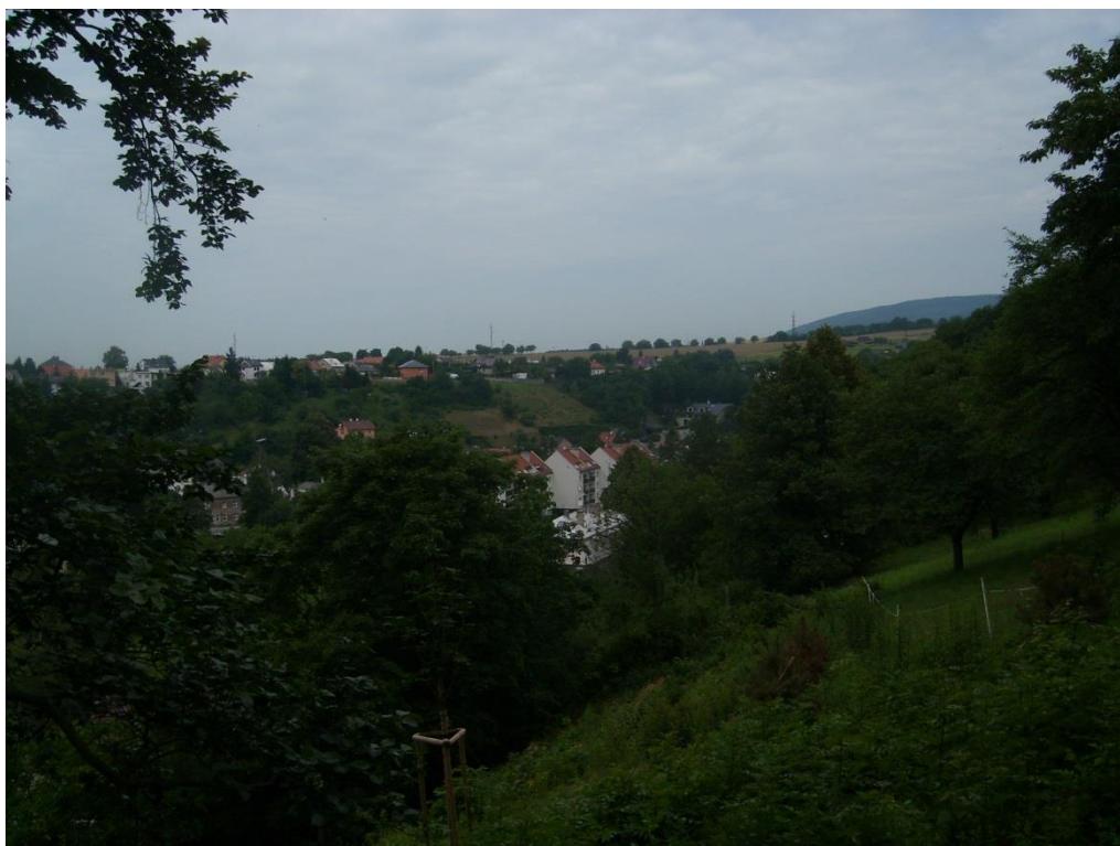
Obr. 23: Hvězdné údolí v lokalitě Šternberk (Milan Poláček, 2012)