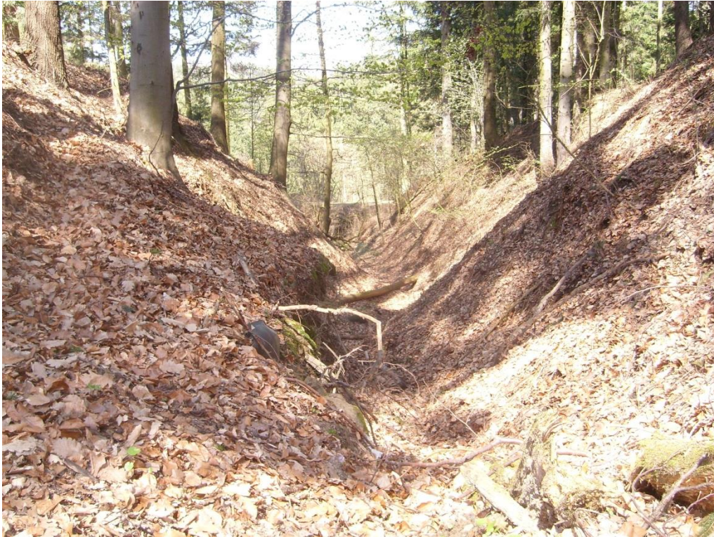
Obr. 21: Strž typu ovrag v lokalitě Za Lesem (Milan Poláček, 2013)