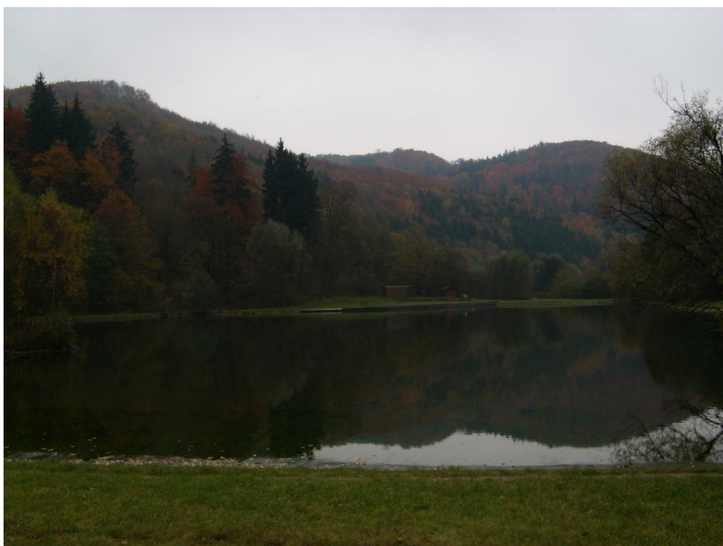
Obr. 24: Přírodní koupaliště v lokalitě Dolní Žleb (Milan Poláček, 2013)