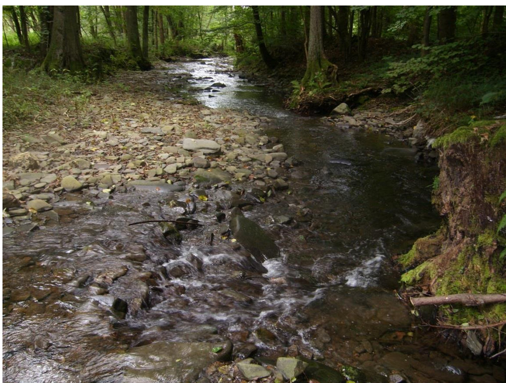
Obr. 4: Meandrující tok Sitky v lokalitě Horní Žleb