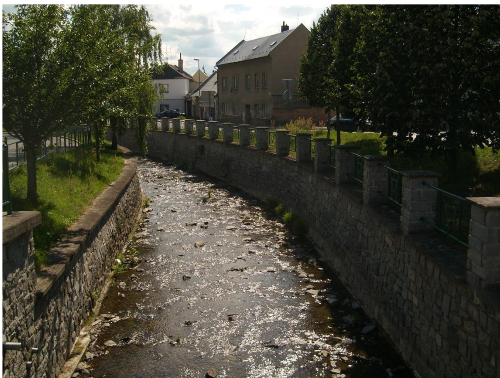
Obr. 6: Upravené břehy toku Sitky v lokalitě Šternberk (Milan Poláček, 2013)