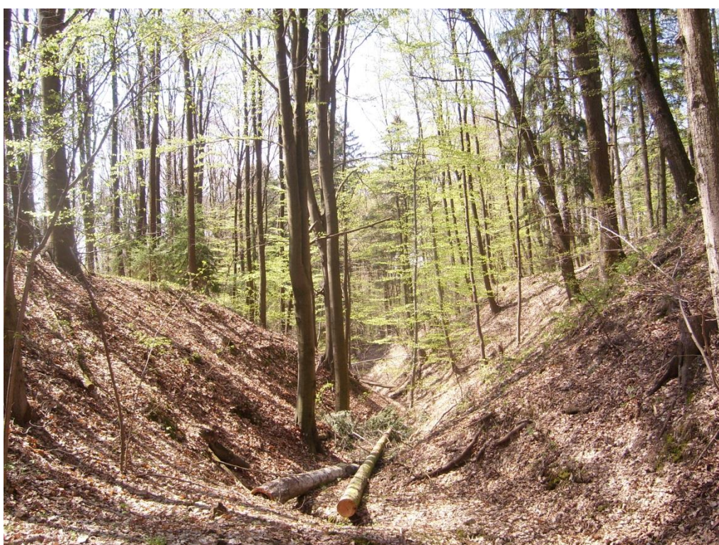
Obr. 20: Strž typu ovrág v lokalitě Za Lesem (Milan Poláček, 2013)