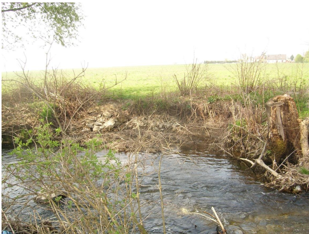
Obr. 13: Břehová nátrž v lokalitě Lužice