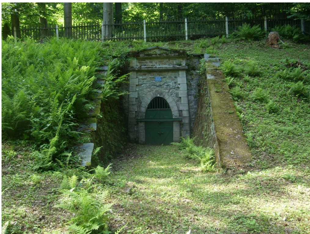
Obr. 27: Vstupní portál Levínské štolý v Lokalitě Chabičovsko (Milan Poláček, 2012)