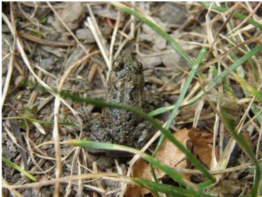
Obr. 16 Metamorfovaný jedinec kuňky ohnivé ( Bombina orientalis)