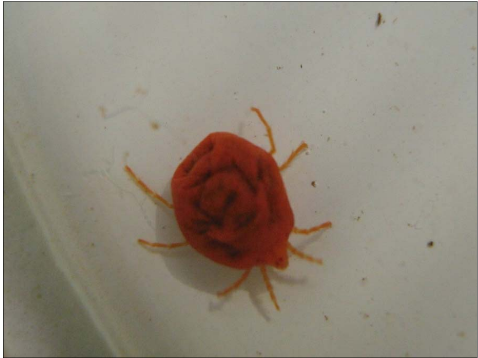
Obr. 26 Roztoč rodu Hydracarina (, 15. 4. 2009)