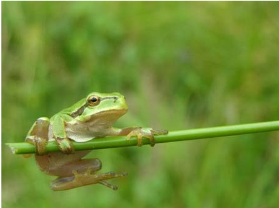
Obr. 18 Rosnička zelená ( Hyla arborea) – juvenilní jedinec (, 12. 8. 2008)