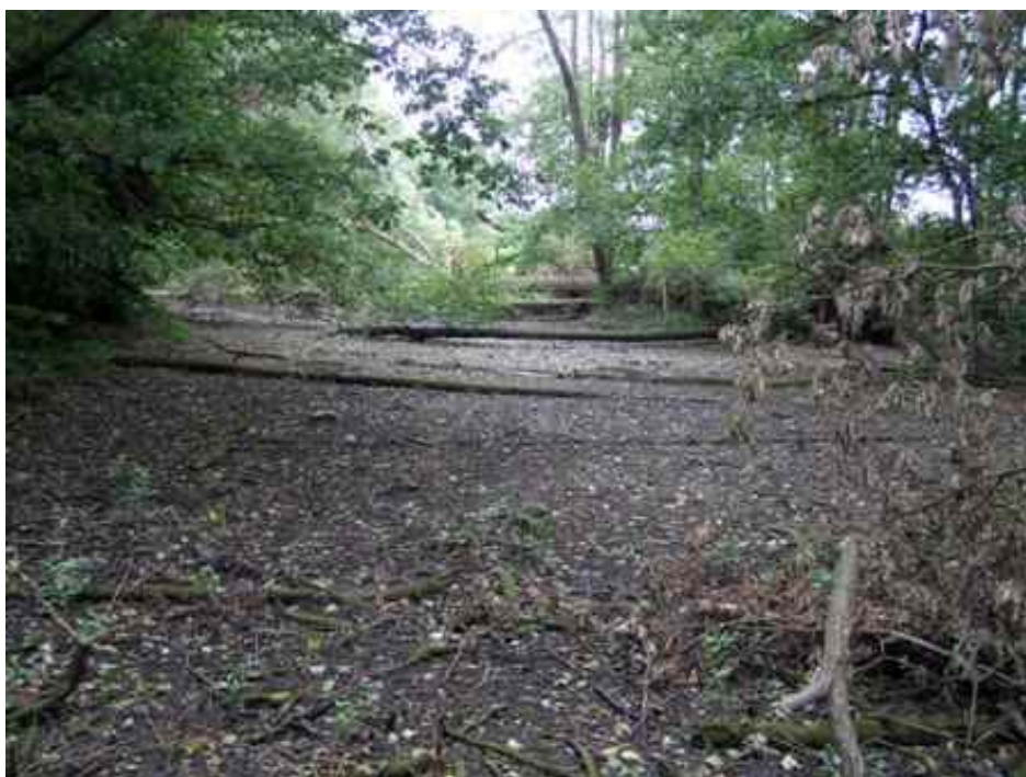
Obr. 11 Mělčina v západní části rybníka – útočiště kuňky ohnivé ( Bombina bombina)