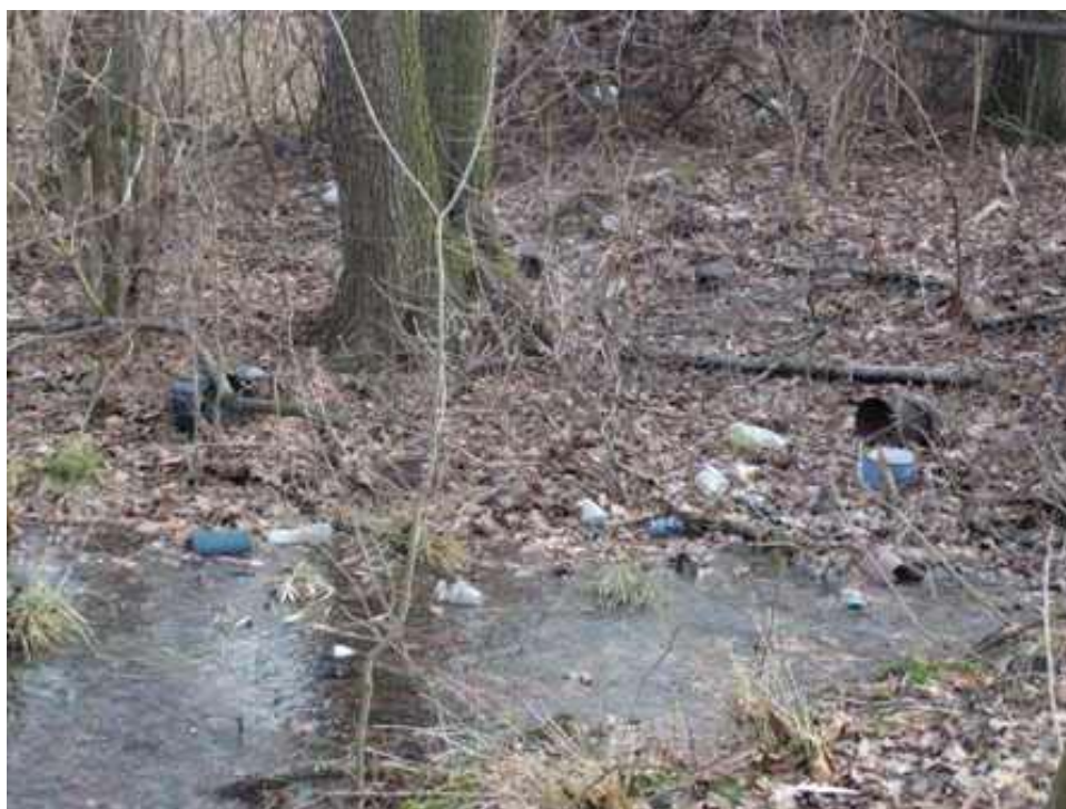
Obr. 5 Divoká skládka