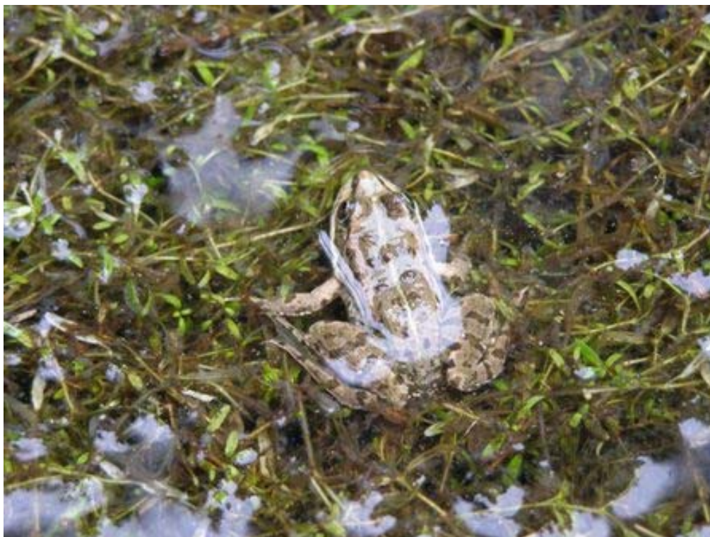
Obr. 20 Subadultní jedinec skokana skřehotavého ( Rana ridibunda)