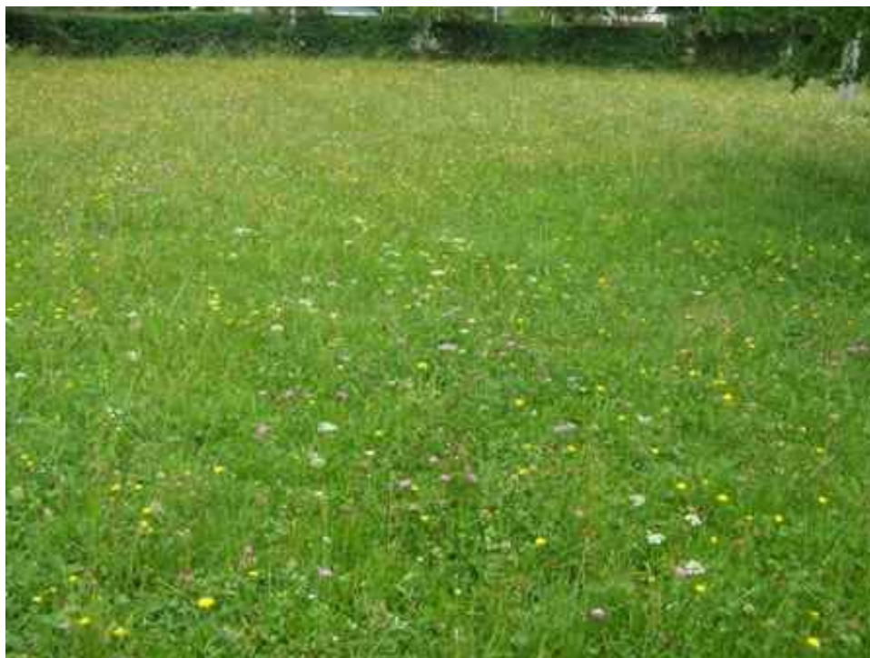
Obr. 7 Pravidelně kosená, tj. druhově bohatá, louka