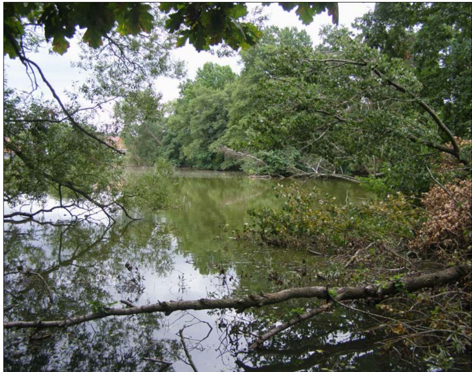
Obr. 3 Mrtvé dřevo částečně oddělující zátoku od zbytku rybníka