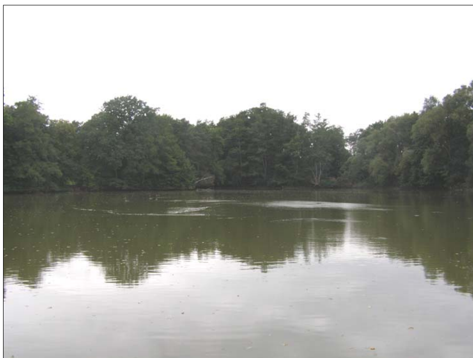
Obr. 2 Pohled ze stavidla vpřed (obec v zádi) (, 10. 4. 2009)