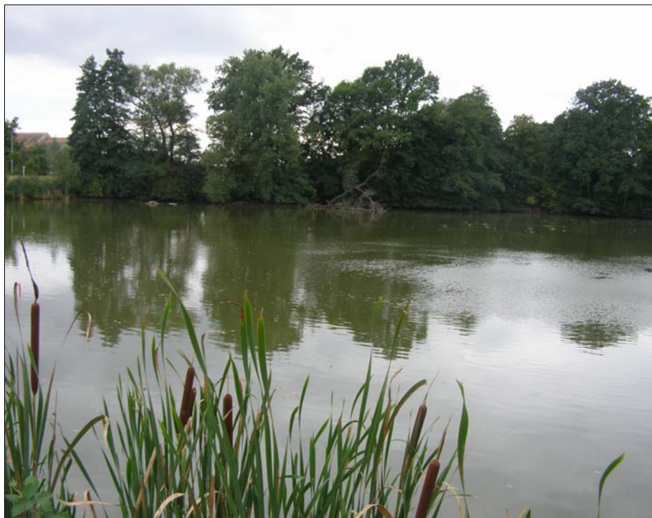
Obr. 1 Pohled směrem vlevo od stavidla