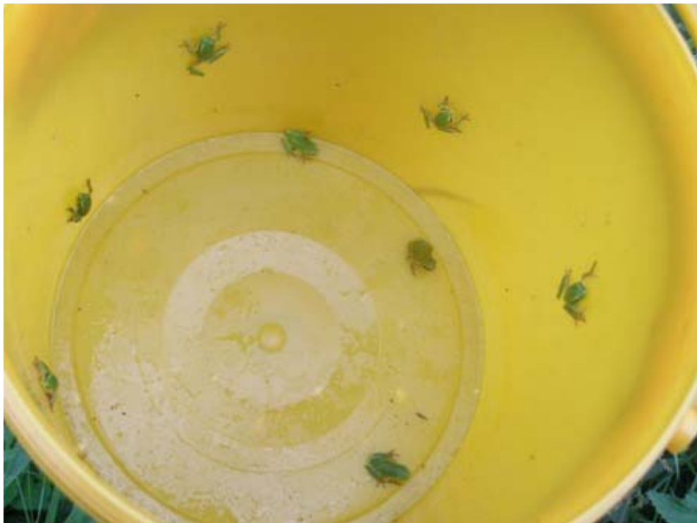
Obr. 19 Doložení výskytu čerstvě metamorfovaných jedinců rosničky zelené