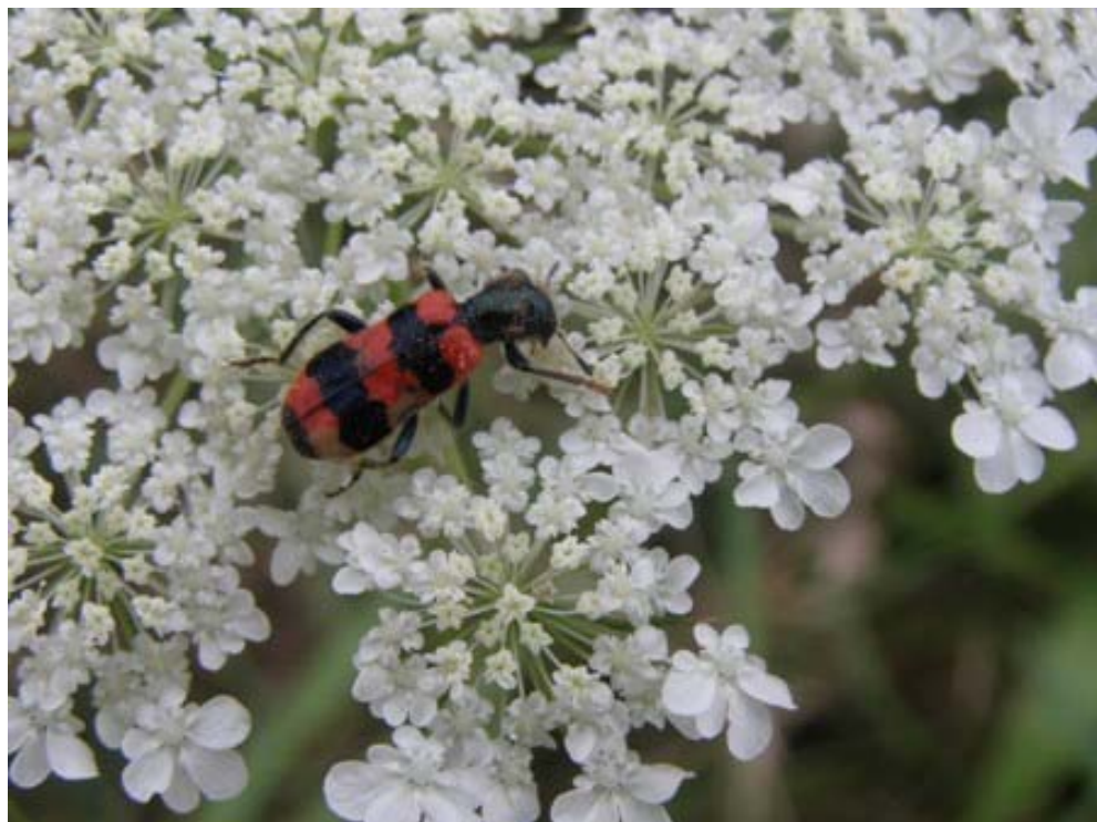
Obr. 15 Pestrokrovečník včelový ( Trichodes apiarius )