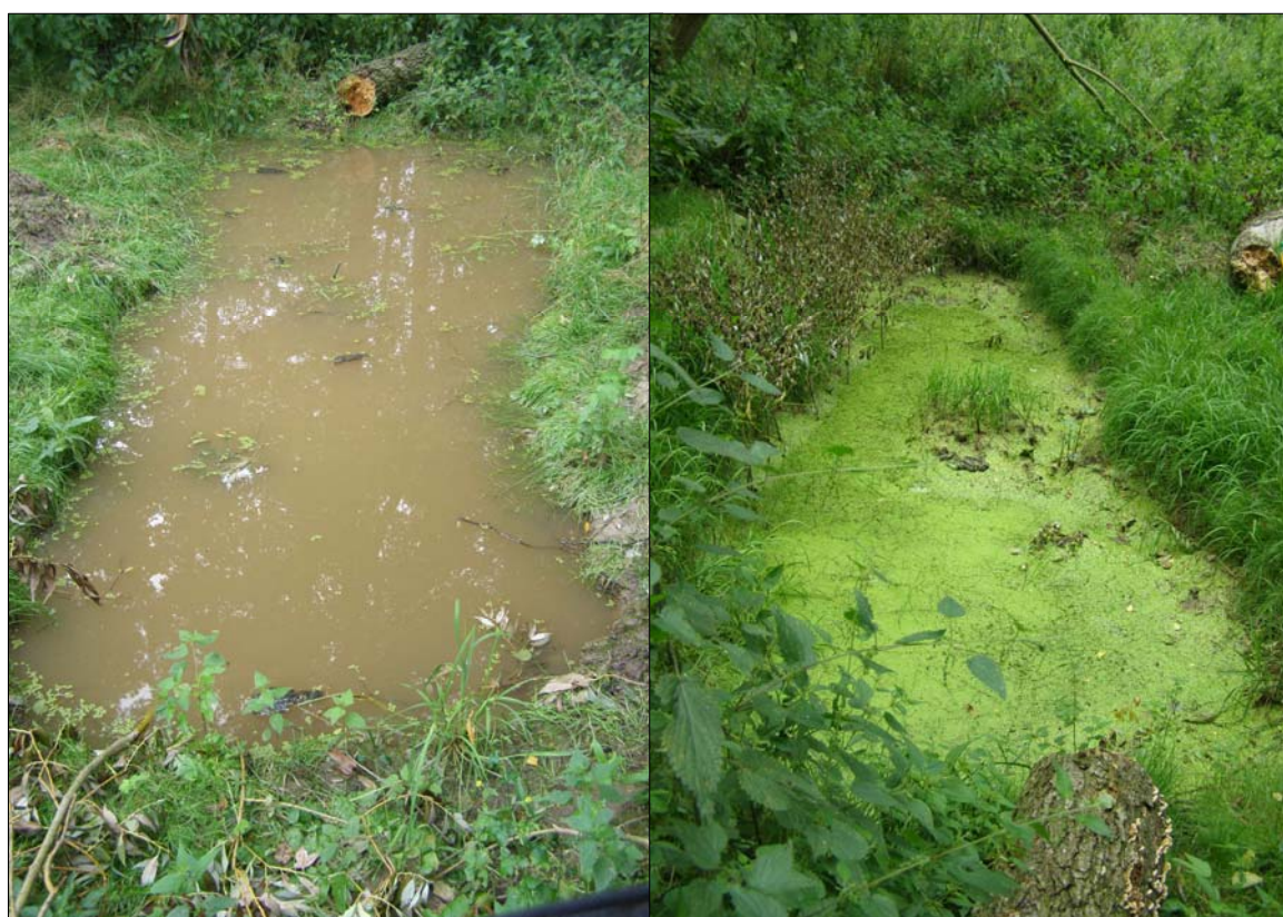
Obr. 8 – Uměle vytvořená zkusná tůňka pro obojživelníky (, 8. 8. 2009, 10. 4. 2009)