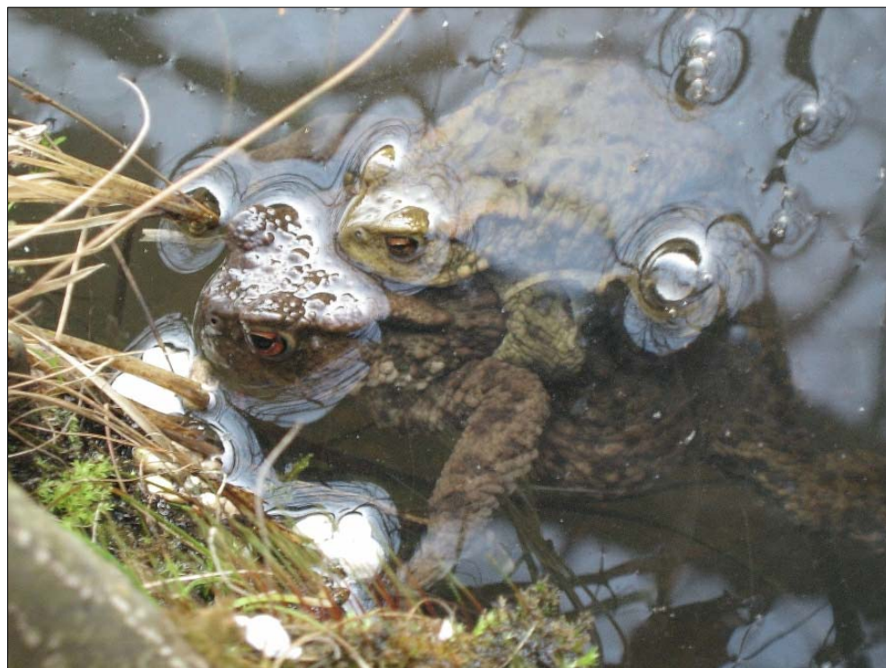
Obr. 21 Kopulující pár ropuchy obecné ( Bufo bufo) v amplexu (, 12. 4. 2008)