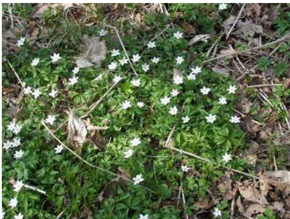
Obr. 6 Jarní aspekt – sasanka hajní ( Anemone nemorosa)