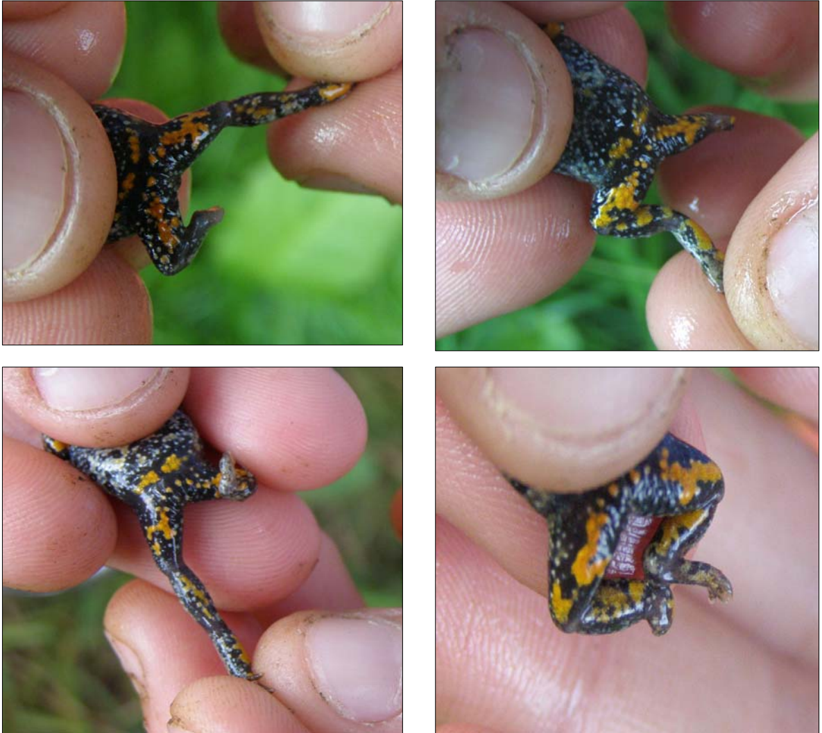
Obr. 13 Amputace dolních končetin u kuňky ohnivé ( Bombina orientalis)