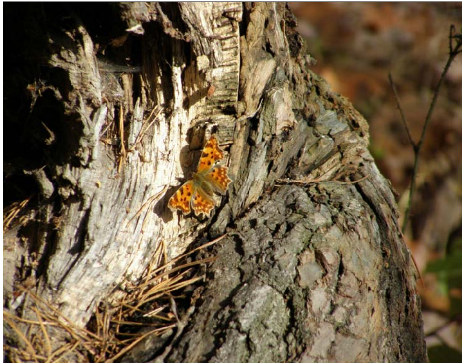
Obr. 14 Babočka jilmová ( Nymphalis polychloros )