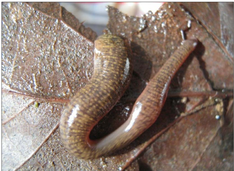
Obr. 25 Hltanovka bahenní ( Erpobdella octoculata)