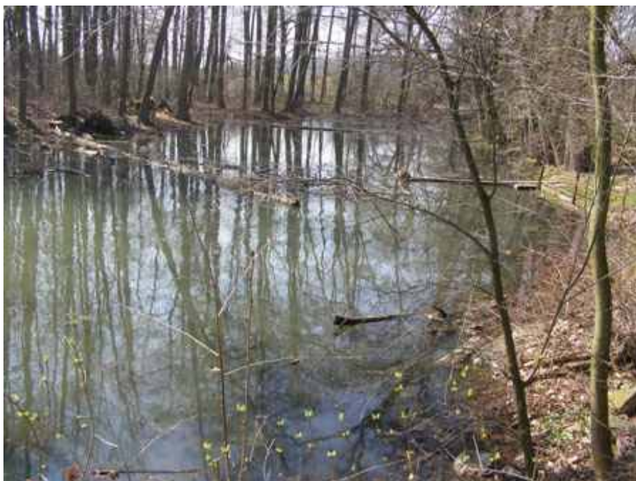
Obr. 12 Mělčina v západní části rybníka (, 10. 4. 2009)