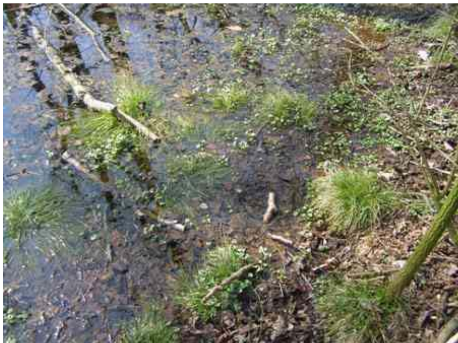
Obr. 4 Stav litorální vegetace v včasném předjaří