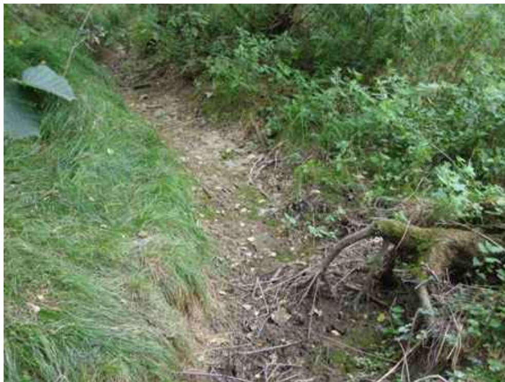
Obr. 10 Zcela vyschlé koryto potoka před vybudováním hrázky