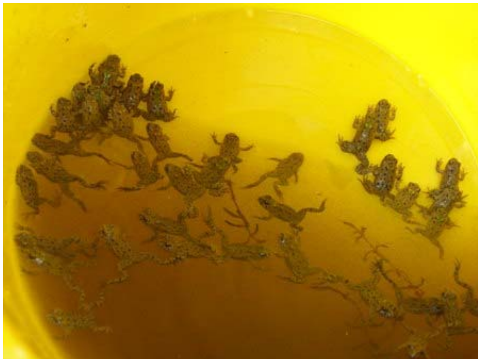
Obr. 17 Doložení výskytu čerstvě metamorfovaných jedinců kuňky ohnivé