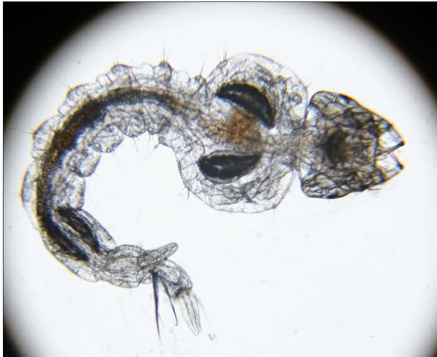
Obr. 28 Larva čeledi komárovití ( Culicidae)