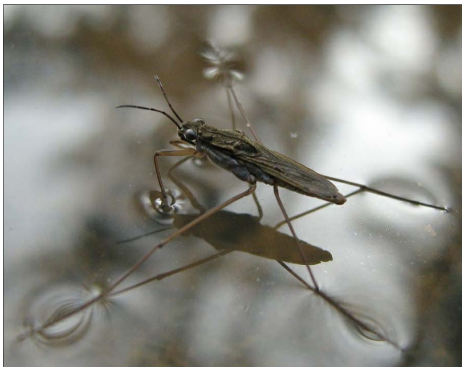
Obr. 23 Bruslařka obecná ( Gerris lacustris)