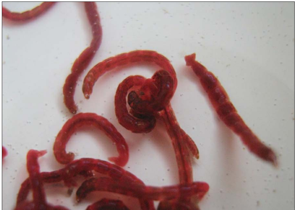
Obr. 27 Larvy pakomára kouřového ( Chironomus plumosus)