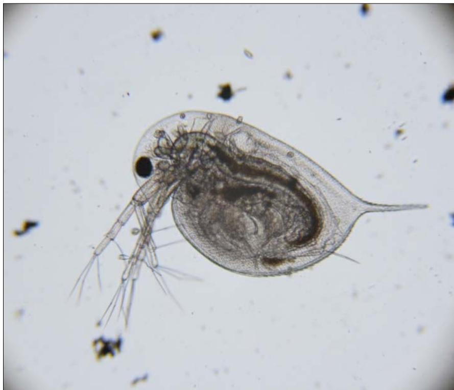
Obr. 29 Perloočka Daphnia spp.