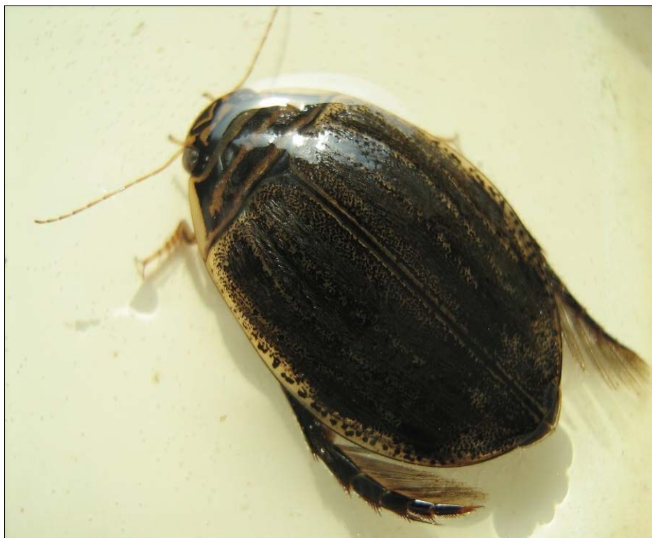
Obr. 22 Samice potápníka rýhovaného ( Acilius sulcatus)