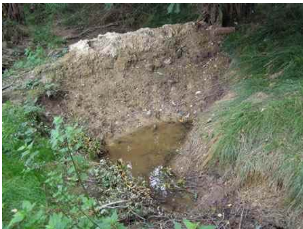
Obr. 9 Jílová hrázka pro vzednutí vody v potoce a přilehlé tůňce