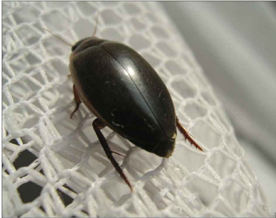
Obr. 24 Zástupce čeledi Potápníkovití ( Dytiscidae) rodu Agabus