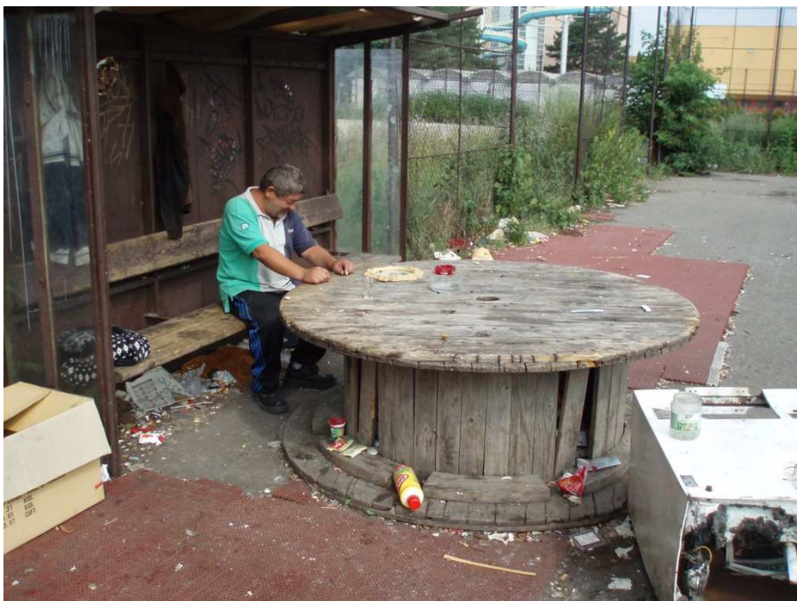
Obr. 7: Místo posezení bezdomovců

otevřeno). Bezdomovci, kteří si přivydělávají sběrem, praktikují tuto činnost většinou dopoledne. Někteří se dle svých slov jen tak prochází či čtou noviny. Dva respondenti odpověděli, že pravidelně navštěvují K Centrum, což je zařízení pro osoby trpící drogovou závislostí. Odpoledne a k večeru se většinou scházejí do větších skupin a večer spolu posedí. Na obrázku 7 je vyfoceno jedno místo takových schůzek. Pokud ovšem dochází peníze, jde někdo ze skupiny žebrot či jinak obstarat finanční prostředky. Ke spánku ulehají také podle počasí, když prší, chodí se spát i v 6 hodin odpoledne.