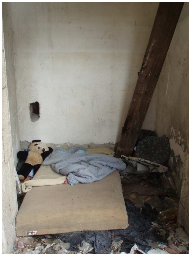
Obr. 6: Výklenek ve zdi, označený obyvateli za squat