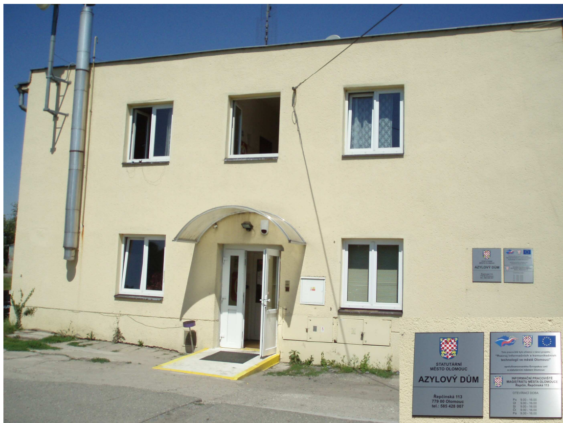
Obr. 1: Azylový dům, zařízení Statutárního města Olomouce pro muže