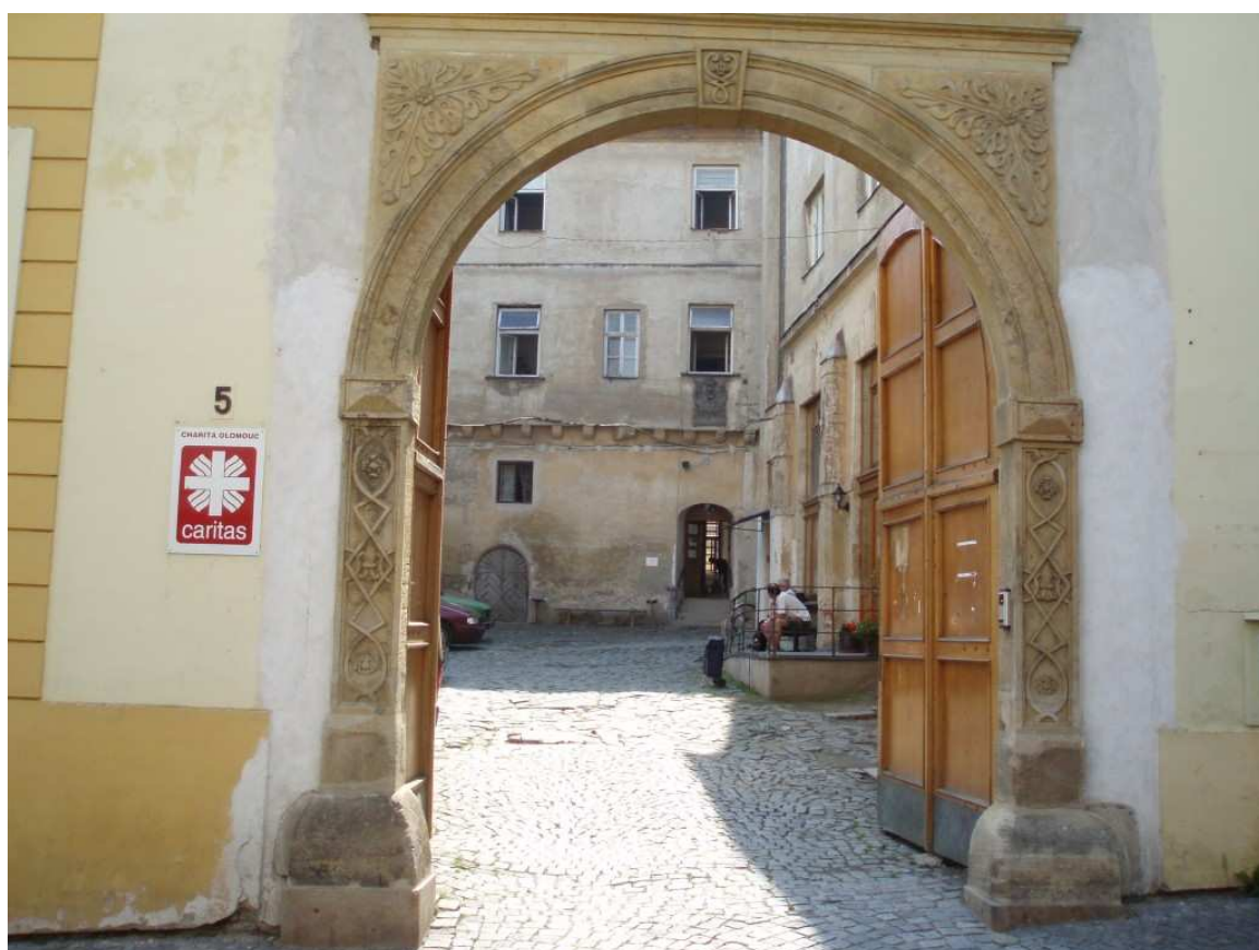
Obr. 2: Vchod do areálu Charity Olomouc