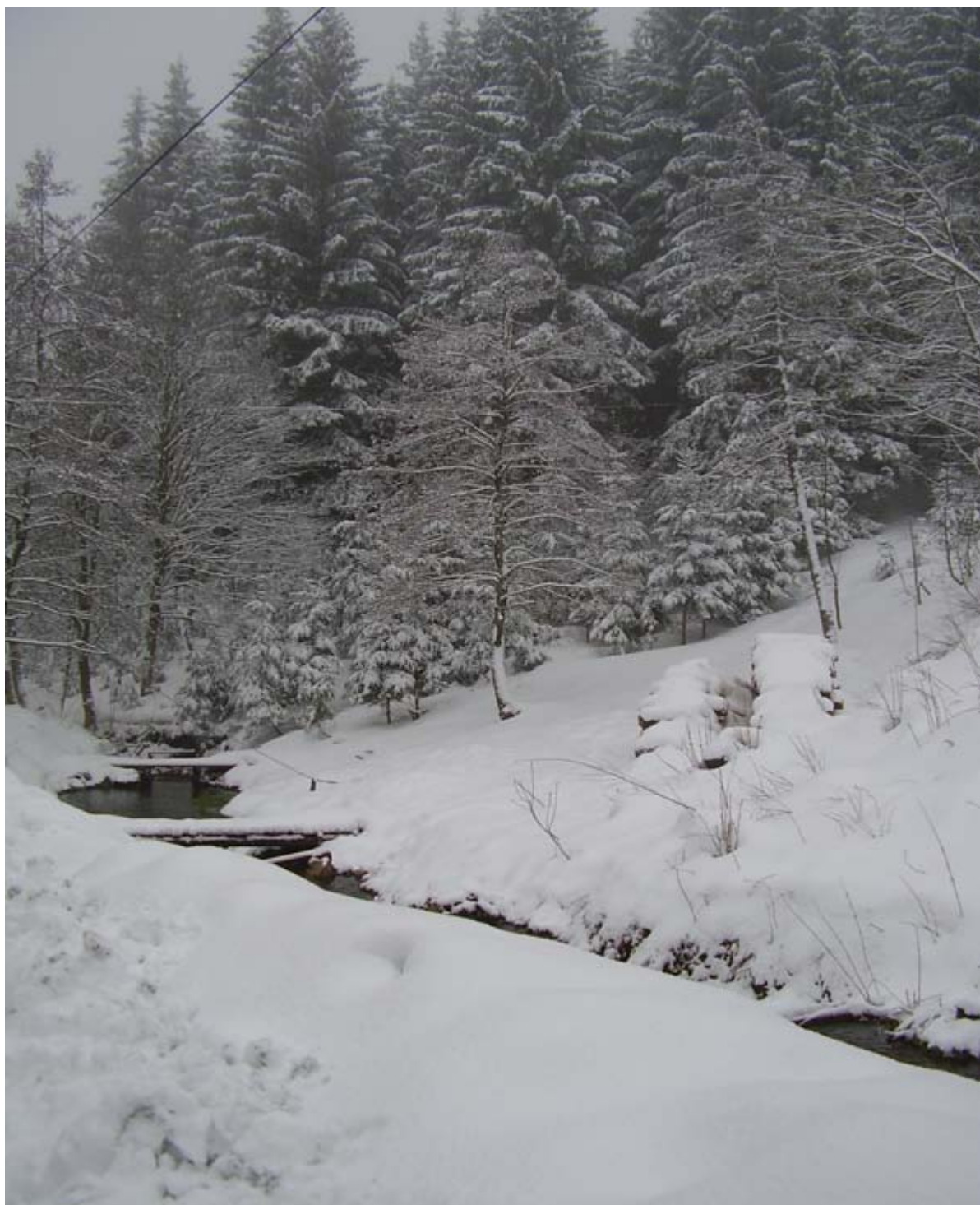
Obr. 4.12 Vrbenský potok v blízkosti obce Velké Vrbno ( 26. 2. 2007).