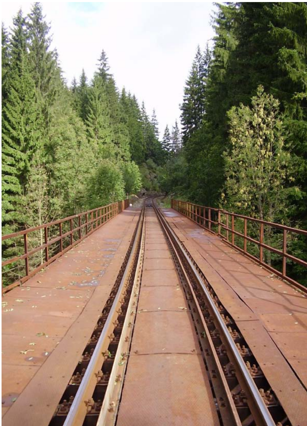
Obr. 4.4 Železniční trať vedoucí do Starého Města.