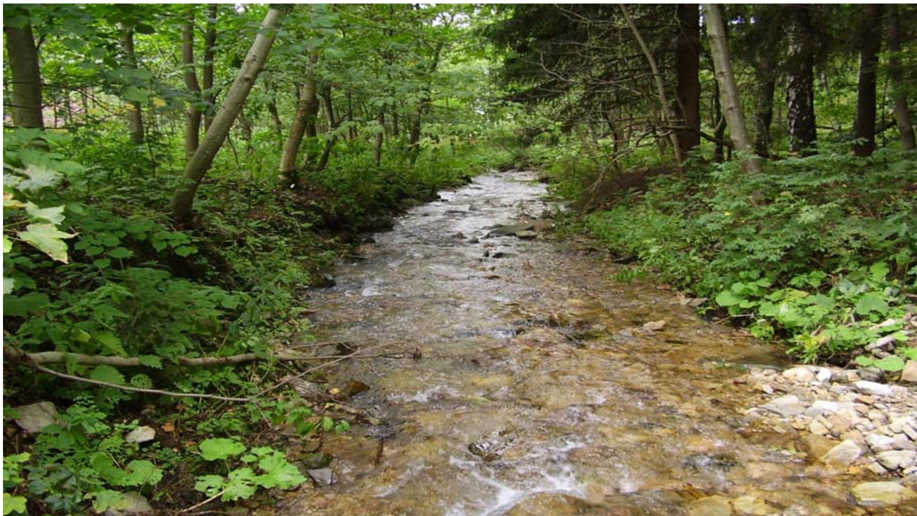
Obr. 4.3 Řeka Krupá 0,5 km od obce Nová Seninka.