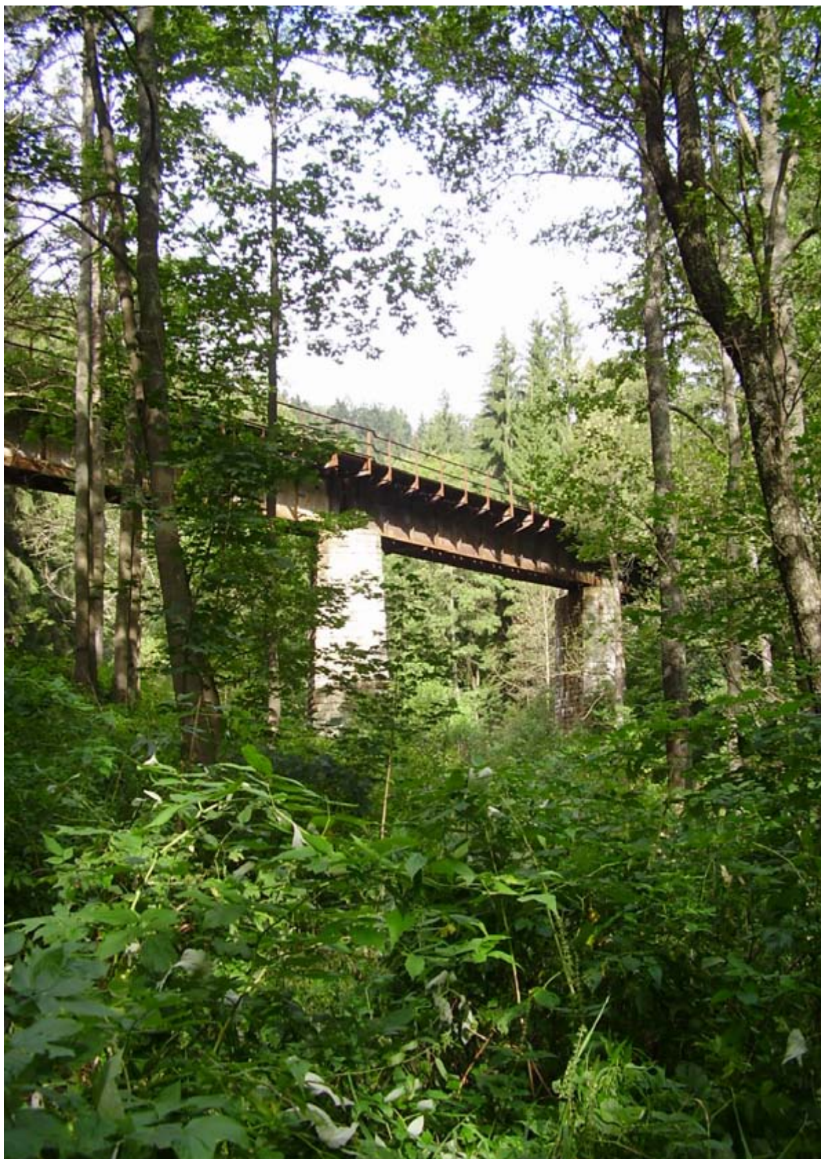
Obr. 4.8 Železniční viadukt přes údolí řeky Krupé ( 12. 9. 2006).