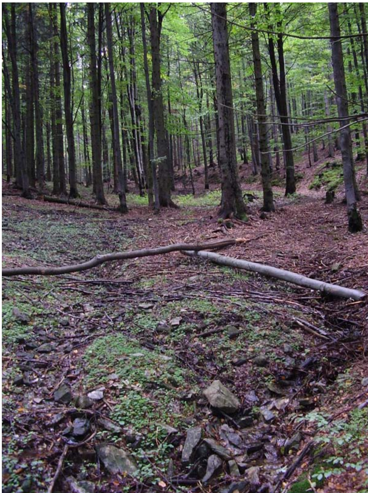
Obr. 4.10 Bukový les při úpatí Kladského sedla ( 12. 9. 2006).