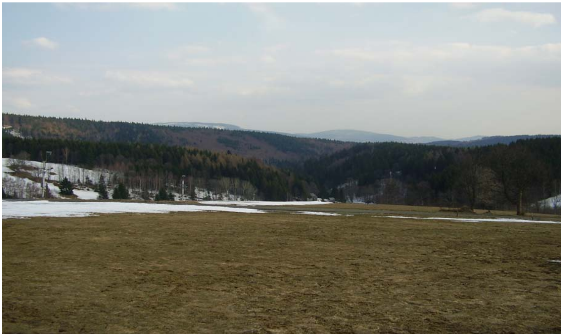
Obr. 4.11 Pohled na lyžařský vlek v údolí Vrbenského potoka.