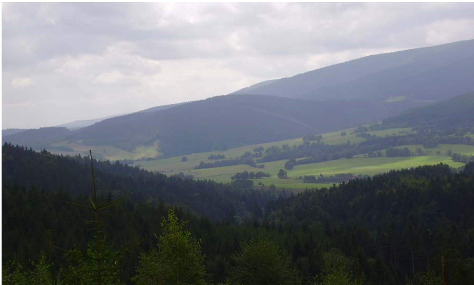
Obr. 4.1 Pohled do údolí Krupé z Kladského sedla.