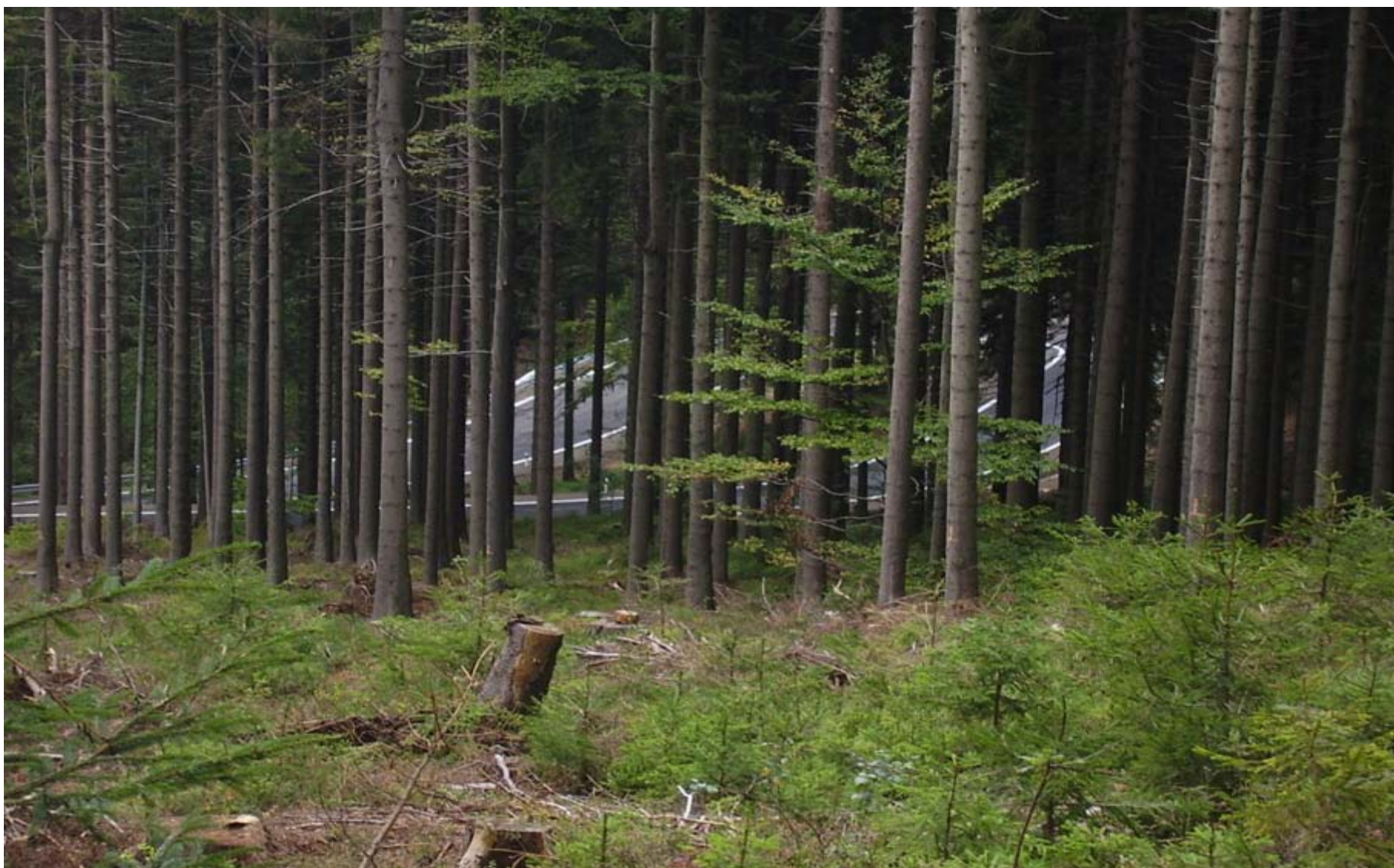
Obr. 4.5 Silnice vedoucí na Kladské sedlo.