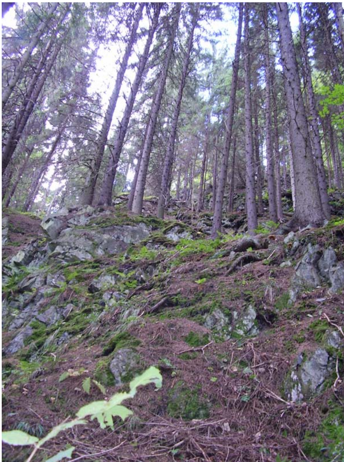
Obr. 4.9 Typické skalnaté svahy s porostem smrku v údolí Krupé ( 12. 9. 2006).