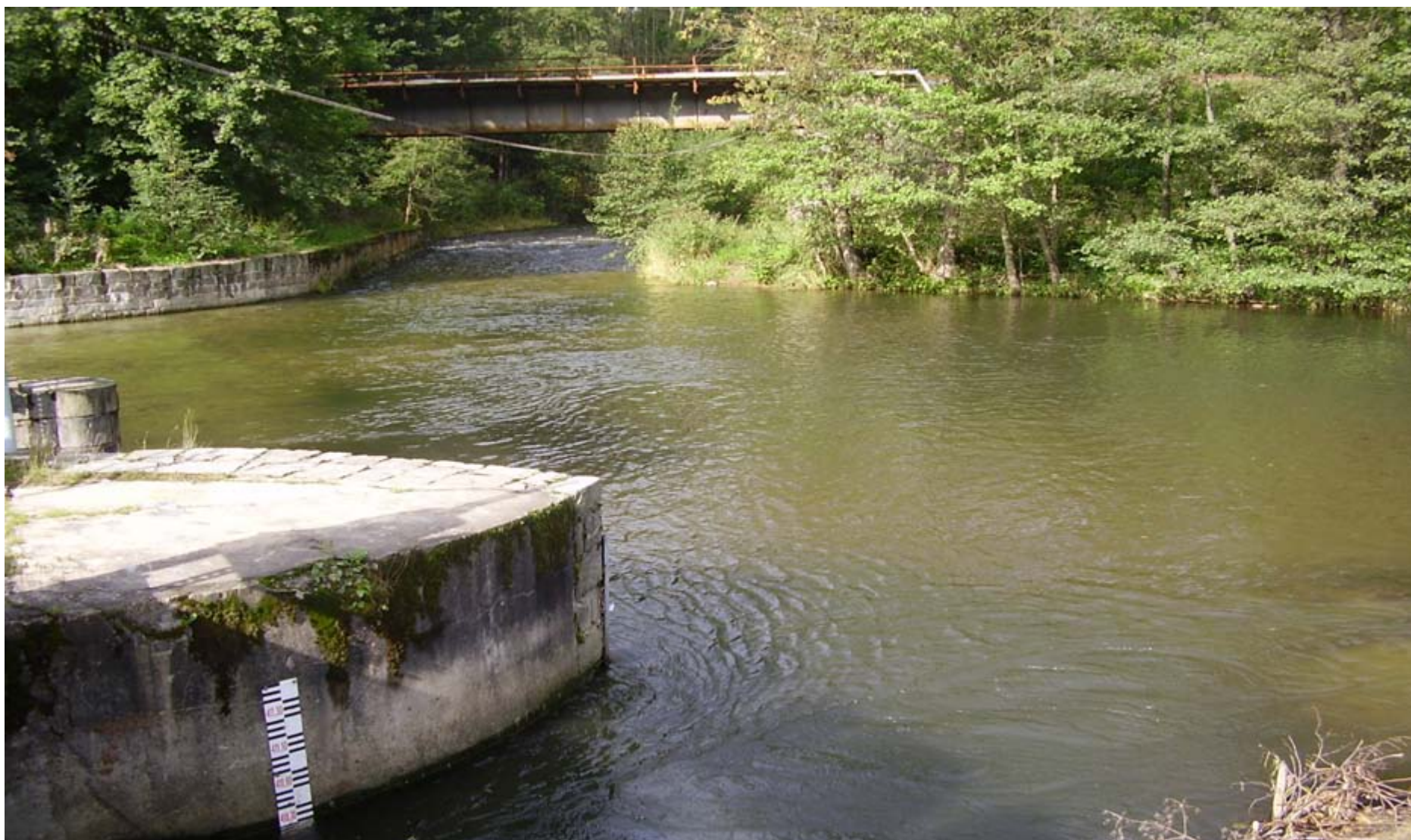
Obr. 4.7 Soutok Krupé a Moravy 1,5 km od Hanušovic ( 12. 9. 2006).