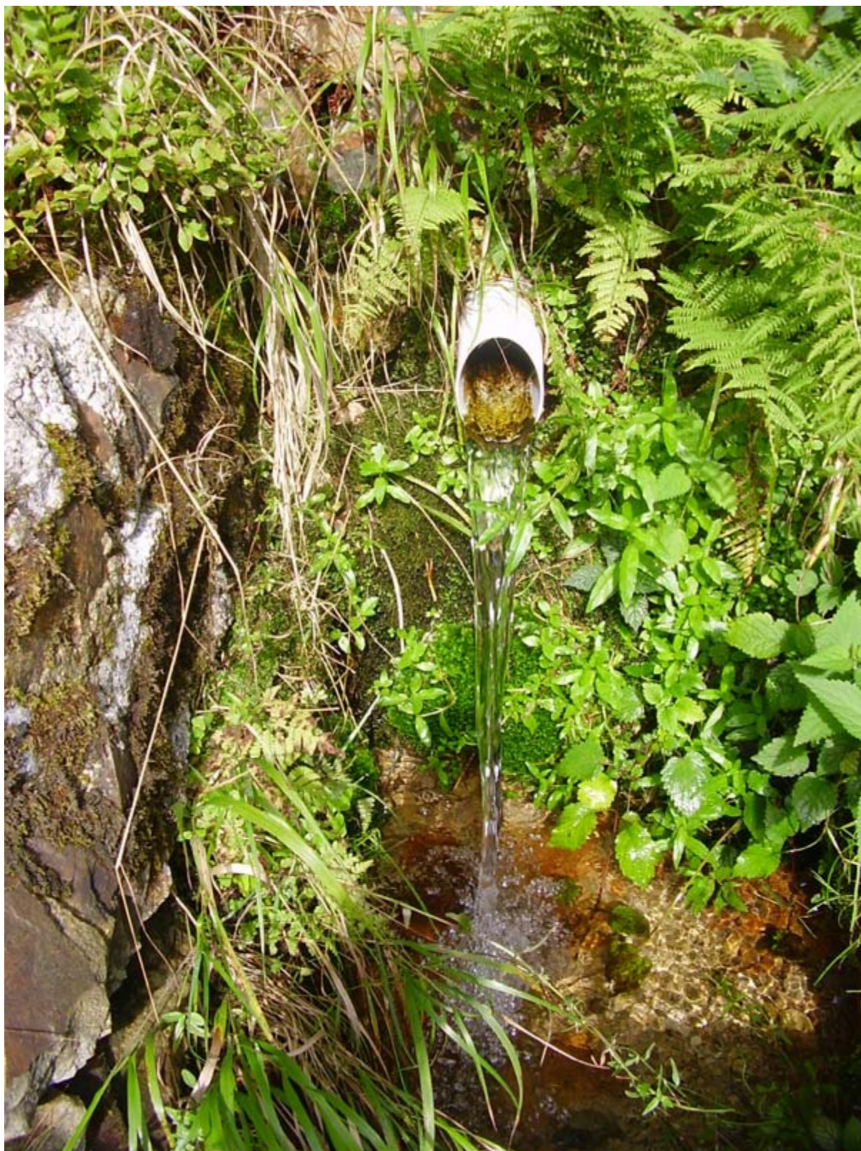
Obr. 4.2 Pramen Krupé na Kladském sedle.