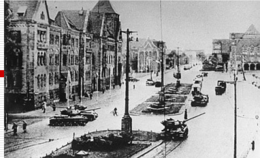
Poznań – stávky, 1956