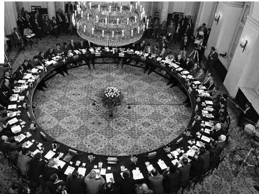
Kulatý stůl - 1989