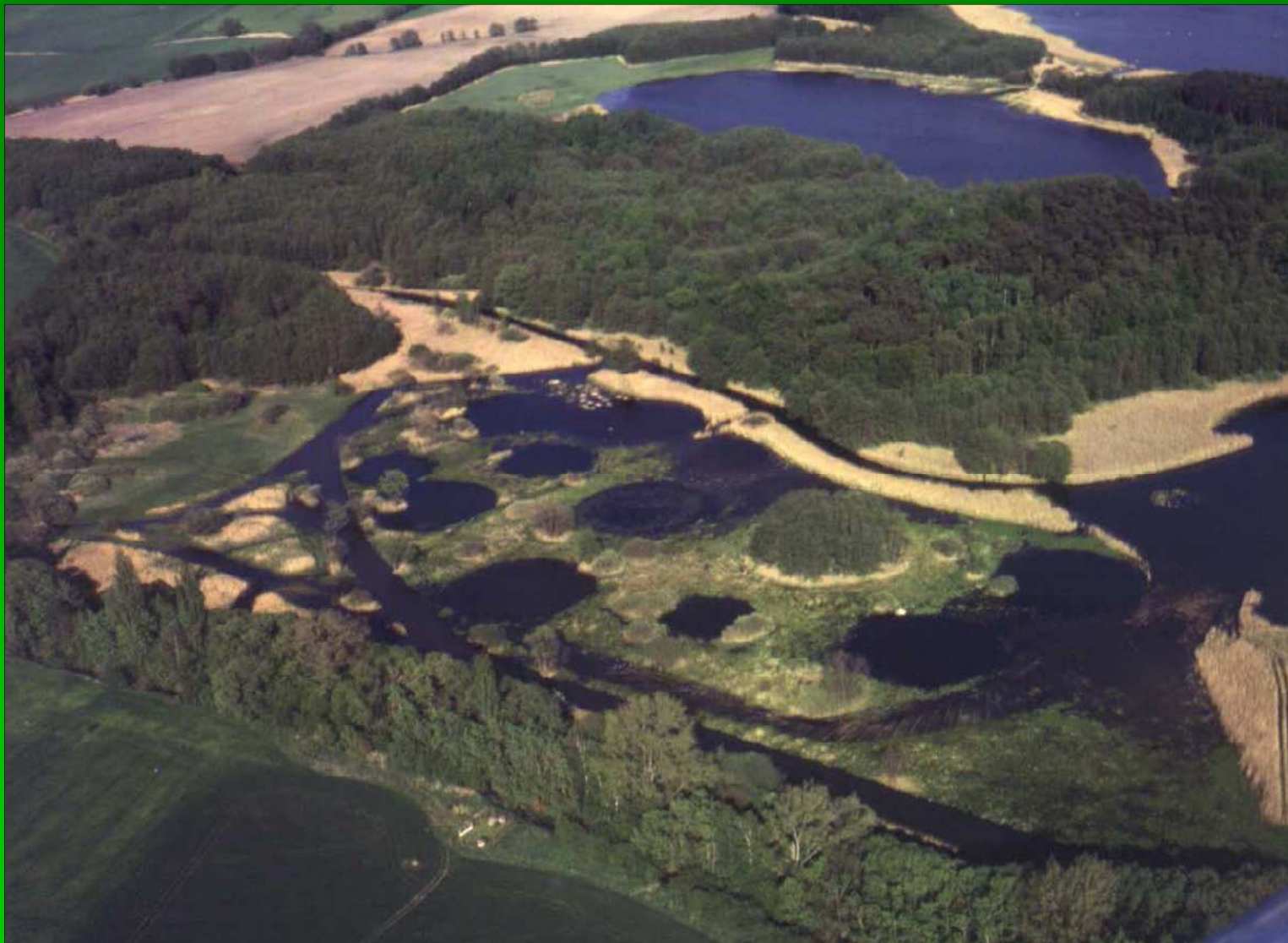
Bohdanečský rybník a rybník Matka