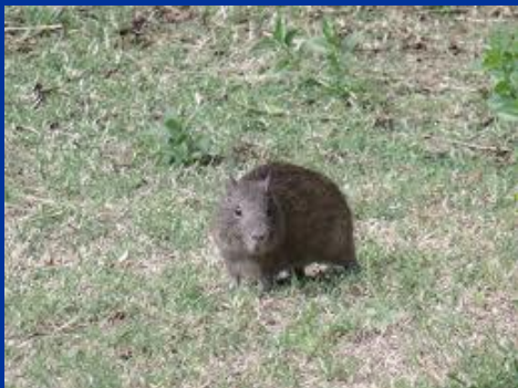
morče Cavia aperea