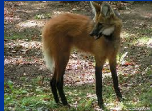
vlk hřivnatý svišť stepní