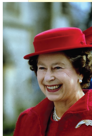
Obr. 54. Královna Alžběta II.

Státní moc může být organizována různými způsoby. Ve většině zemí určuje její podobu jeden základní zákon – ústava . Státní moc zpravidla představují čtyři nejvyšší orgány státu: hlava státu, parlament, vláda a soudy. Tyto orgány sídlí v hlavním městě.